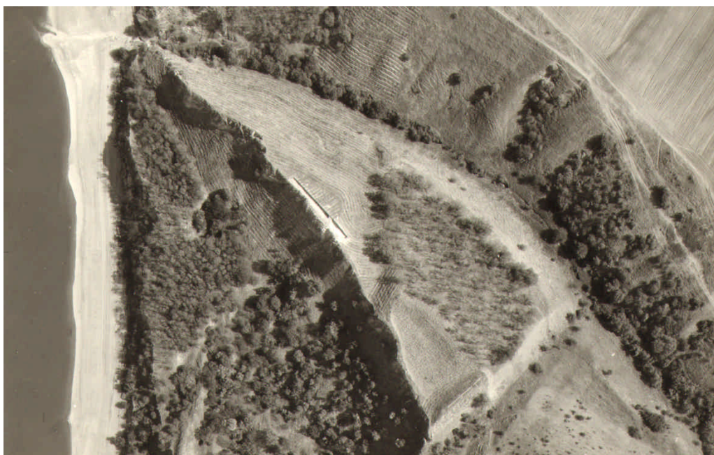
Fig. 7. Așezarea de la Satu Nou–Valea lui Voicu / The settlement at Satu Nou–Valea lui Voicu (fototeca / Courtesy of ICEM-Tulcea).

Chiar în 1990 sunt publicate rezultatele cercetărilor arheologice de la Murighiol–Ghiolul Pietrei, stațiune investigată în perioada 1986-1988 de Gheorghe Mănucu-Adameșteanu și Vasilica Lungu. Cu această ocazie sunt menționate și vestigiile unei așezări specifice fazei a II-a a culturii Babadag 84 .