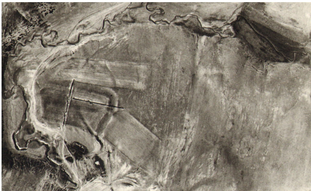
Fig. 5. Situl arheologic de la Beidaud – 1983 / The archaeological site from Beidaud – 1983.

1977 și 1979-1980 72 (Fig. 4-5). Cu această ocazie și ulterior 73 se menționa aici existența unei evoluții cronologice de la sfârșitul epocii bronzului (cultura Coslogeni) și pe tot parcursul evoluției culturii Babadag, acestea fiind urmate de o locuire hallstattiană târzie încadrată în sec. VI-V a.Chr.