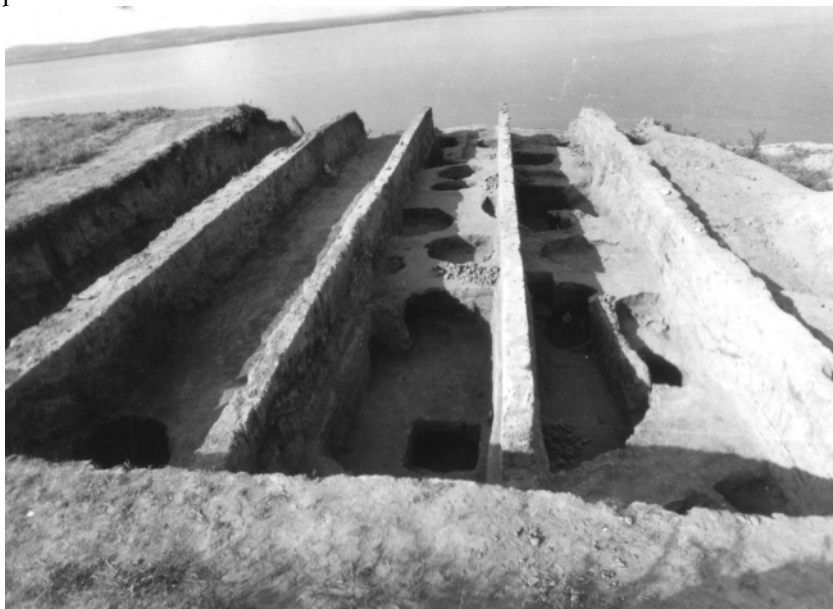
Fig. 6. Așezarea de la Babadag. Aspecte din timpul cercetării – Suprafața A, 1971 (fototeca ICEM-Tulcea) / The settlement from Babadag. Photo taken during excavation – Surface A, 1971 (courtesy of ICEM-Tulcea).

Morintz aduna aici toate datele cunoscute la acea vreme despre perioada hallstattiană timpurie și mijlocie în zona istro-pontică , având ca principal reper rezultatele cercetărilor de la Babadag. Gândită ca o reargumentare a periodizării propuse în 1964, lucrarea aduce în discuție și noile grupuri culturale definite precum Sihleanu, Tămăoani, Insula Banului, Cozia, Pșenicevo etc. pe care le pune în legătură cu cele trei faze delimitate anterior. Pe ansamblu, acest articol a rămas și în prezent principalul reper în studierea culturii Babadag, fiind unanim recunoscut de cercetătorii preocupați de această perioadă.