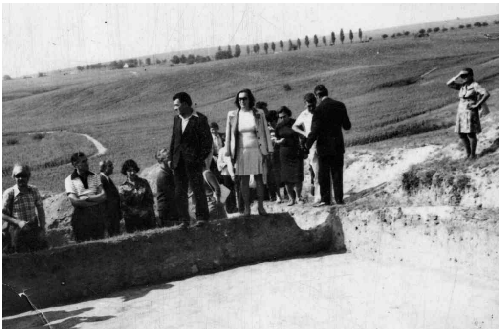
Fig. 3. Vizită pe șantierul arheologic Babadag în timpul celui de al II-lea Congres de Tracologie (1976) 51 / A visit on the archaeological site from Babadag during the 2 nd Congress of Thracology (1976).