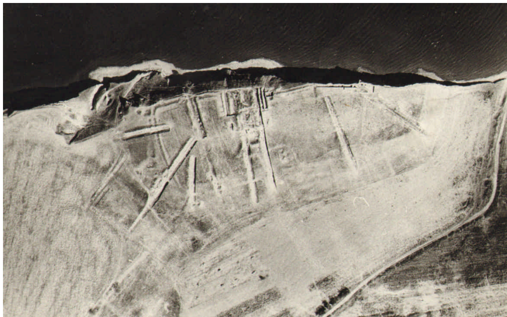
Fig. 2. Așezarea din prima epocă a fierului de la Babadag / The Early Iron Age settlement at Babadag.