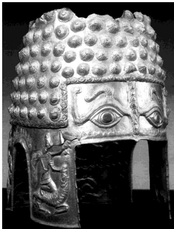
Pl. 7. Coiful de la Poiana-Coțofenești / The helmet from Poiana-Coțofenești.

Andrieșescu se referă cu siguranță la Movila Mare– aflată la ieșirea din satul Mănești spre Coadă Izvorului, pe partea stângă a șoselei Mănești-Coadă Izvorului. Cercetări de suprafață realizate de Cezar Bolliac. Au fost descoperite fragmente ceramice atribuite culturii Glina și o dălțiță din cupru. Au mai fost descoperite arme și unelte de silex, vârfuri de săgeți și fragmente ceramice lucrate din pastă fină cu ornamente adâncite și în relief 53 .