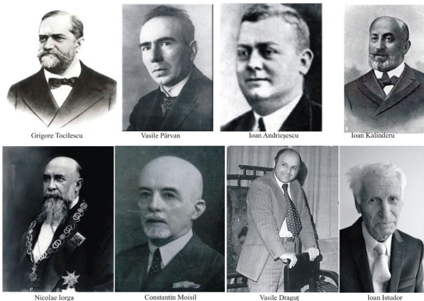
Pl. 4. Specialiști din domenii conexe conservării și restaurării patrimoniului / Specialists in areas related to conservation and restoration of heritage.

Interesul pentru conservarea operei de artă se regăsește și în cadrul Institutului de Arte Plastice Nicolae Grigorescu, în anii 1970 65 .