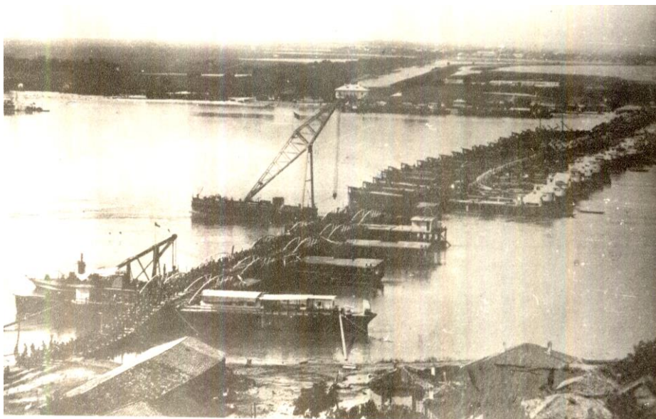
Trecerea trupelor române peste Dunăre, Flămânda, 1916 (The Romanian troops cross over Danube, Flămânda, 1916)

Sprijinul acordat prin susținerea cu focul bateriilor de pe monitoare s-a dovedit util și benefic pentru apărarea capului de pod 17 . Bateriile debarcate de pe nave, precum „Elisabeta”, și bateriile „Principele Mircea”, „Regele Ferdinand” și „Regina Maria” și-au adus, la rândul lor, aportul și au ripostat la atacurile forțelor bulgaro-germane 18 . Începând cu acordarea de sprijin în acțiunea de salvare a trupelor în retragere spre Silistra și continuând cu acțiunile de la Derwent, Oltina, Parachioi și până la Rasova, navele Flotei de operațiuni au participat la toate luptele, susținând flancul drept al armatei și atacând, prin numeroase incursiuni, spatele frontului inamic și coloanele lui de aprovizionare, în toate aceste acțiuni marinarii demonstrând curaj și spirit de sacrificiu 19 .