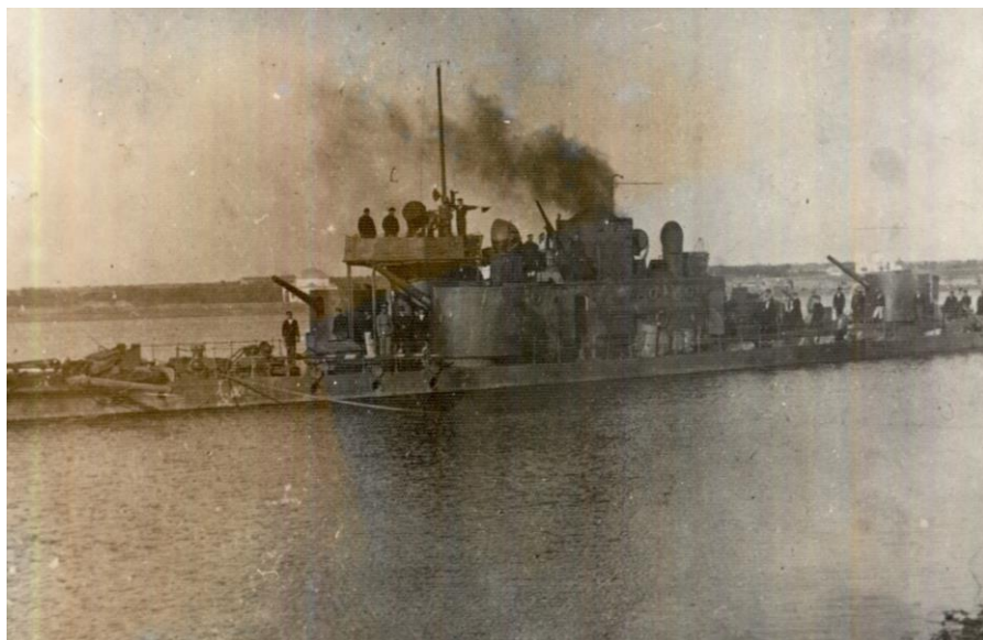
Monitor în marș pe Dunăre în Al Doilea Război Mondial (Danube monitor in march on the river. The Second World War)

Unul din episoadele în care marinarii români au dat dovadă de spirit de sacrificiu și eroism s-a petrecut atunci când forțele adversarului au reușit să instaleze cuiburi de mitraliere de-a lungul Văii Cusui și a barat retragerea forțelor române. În acest scop, vedetele nr. 6 „Maior Nicolae Grigore Ioan” și nr. 2 „Căpitan Mihail Romano” au primit misiunea de a înainta pe Canalul Cusui, până în apropierea malului, pentru a lovi din imediata apropiere amplasamentele armelor automate dușmane. Un foc nimicitor a deschis vedeta nr. 6 „Maior Nicolae Grigore Ioan”, care s-a apropiat doar la câțiva metri de cuiburile de mitraliere dușmane, reducându-le la tăcere.