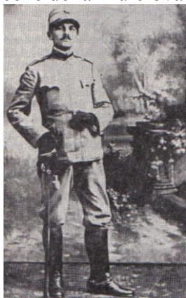
Lt. Oprea Hârâciu – eroul Medgidiei 3

Dintre cei care și-au dat viața pe câmpul de luptă în Primul Război Mondial se numără și învățătorul Oprea Hârâciu din Medgidia. Acesta se stabilise în Medgidia pe 10 noiembrie 1908, ca soldat al Regimentului 34 Infanterie Constanța, unde își satisfacea stagiul militar. Lăsat la vatră după un an, s-a stabilit definitiv la Medgidia și a ocupat postul de învățător. La 23 iunie 1913 este mobilizat și participă la campania militară din cel de-Al Doilea Război Balcanic, fiind decorat cu medalia „Avântul Țării”, alături de alți soldați ai orașului. La 15 august 1916 va fi mobilizat și va pleca pe front cu Regimentul 78 Infanterie. Trei săptămâni mai târziu avea să moară în luptele crâncene de la Mulciovă 2 .