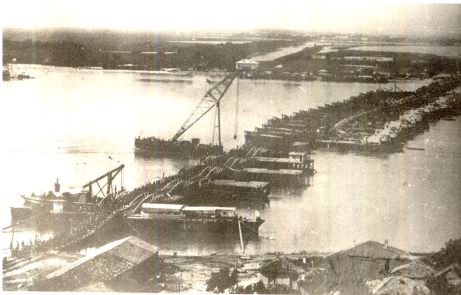
Trecerea trupelor române peste Dunăre, Flămânda, 1916 (The Romanian troops cross over Danube, Flămânda, 1916)

Sprijinul acordat prin susținerea cu focul bateriilor de pe monitoare s-a dovedit util și benefic pentru apărarea capului de pod 17 . Bateriile debarcate de pe nave, precum „Elisabeta”, și bateriile „Principele Mircea”, „Regele Ferdinand” și „Regina Maria” și-au adus, la rândul lor, aportul și au ripostat la atacurile forțelor bulgaro-germane 18 . Începând cu acordarea de sprijin în acțiunea de salvare a trupelor în retragere spre Silistra și continuând cu acțiunile de la Derwent, Oltina, Parachioi și până la Rasova, navele Flotei de operațiuni au participat la toate luptele, susținând flancul drept al armatei și atacând, prin numeroase incursiuni, spatele frontului inamic și coloanele lui de aprovizionare, în toate aceste acțiuni marinarii demonstrând curaj și spirit de sacrificiu 19 .