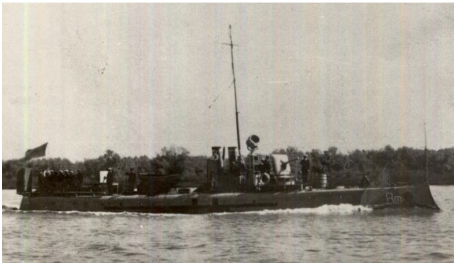
Vedeta de siguranță „MAIOR NICOLAE GRIGORE IOAN” (The „MAIOR NICOLAE GRIGORE IOAN” safety boat)

angajare, vedeta nr. 6 „Maior Nicolae Grigore Ioan” a pierdut toți ofițerii și jumătate de echipaj 16 .