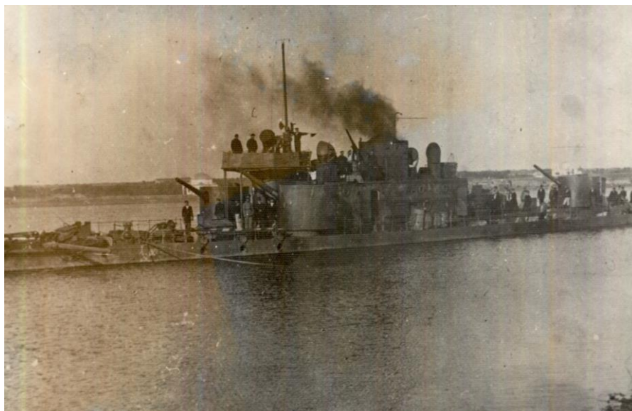
Monitor în marș pe Dunăre în Al Doilea Război Mondial (Danube monitor in march on the river. The Second World War)

Unul din episoadele în care marinarii români au dat dovadă de spirit de sacrificiu și eroism s-a petrecut atunci când forțele adversarului au reușit să instaleze cuiburi de mitraliere de-a lungul Văii Cusui și a barat retragerea forțelor române. În acest scop, vedetele nr. 6 „Maior Nicolae Grigore Ioan” și nr. 2 „Căpitan Mihail Romano” au primit misiunea de a înainta pe Canalul Cusui, până în apropierea malului, pentru a lovi din imediata apropiere amplasamentele armelor automate dușmane. Un foc nimicitor a deschis vedeta nr. 6 „Maior Nicolae Grigore Ioan”, care s-a apropiat doar la câțiva metri de cuiburile de mitraliere dușmane, reducându-le la tăcere.