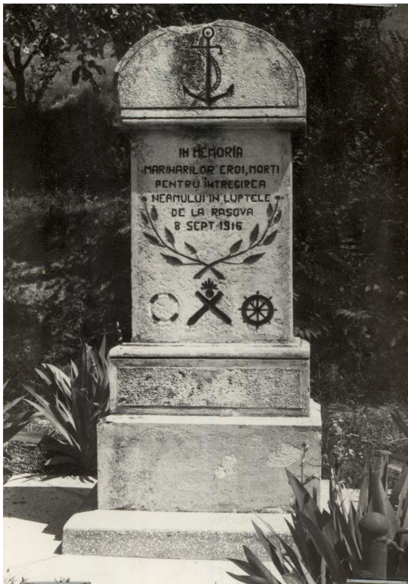
Monumentul marinarilor eroi căzuți la Rasova la 8 septembrie 1916 aflat în parcul expozițional al Muzeului Național al Marinei Române (The Romanian National Naval Museum - Memorial of the Heroes who died on Rasova, 1916, September 8 th )