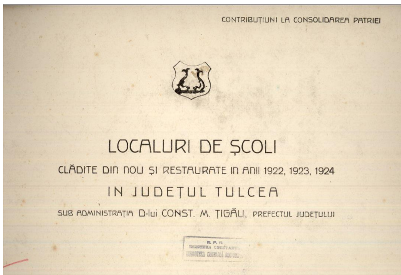
Localuri de școli clădite din nou și restaurate în anii 1922, 1923, 1924 în județul Tulcea [Album], s. n., Tulcea, 1925 (fără paginație)

Documentul, valoros prin vechime și prin modul de prezentare, se constituie într-o „istorie vie” a școlii dobrogene din zona actualului județ Tulcea, fiind o sursă de cunoaștere a modului în care au evoluat școlile județului, cu posibilitatea de a face analogii cu cele din județul Constanța și cu mențiunea că, așa cum scriu chiar autorii albumului, unele școli sunt cu mult mai vechi.