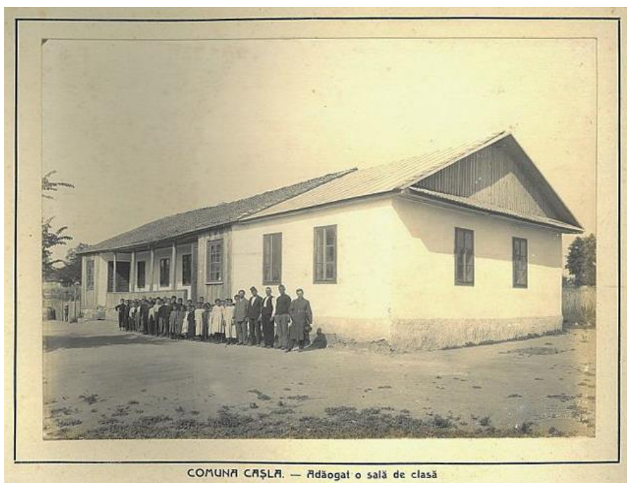
Apud Localuri de școli clădite din nou și restaurate în anii 1922, 1923, 1924 în județul Tulcea [Album], s. n., Tulcea, 1925 (fără paginație)