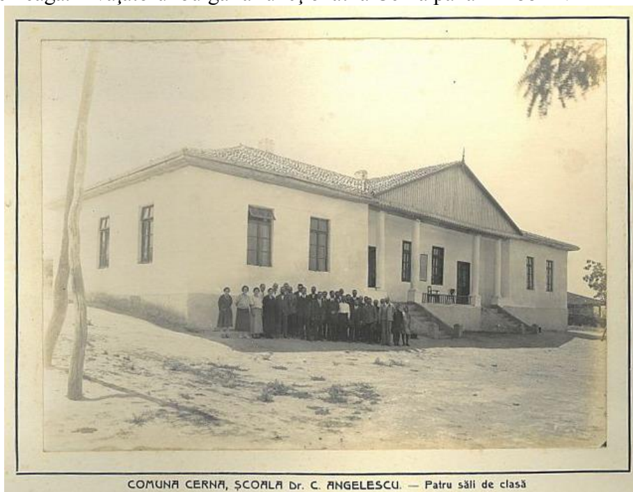
COMUNA CERNA, ȘCOALA Dr. C. ANGELESCU. — Patru săli de clasă