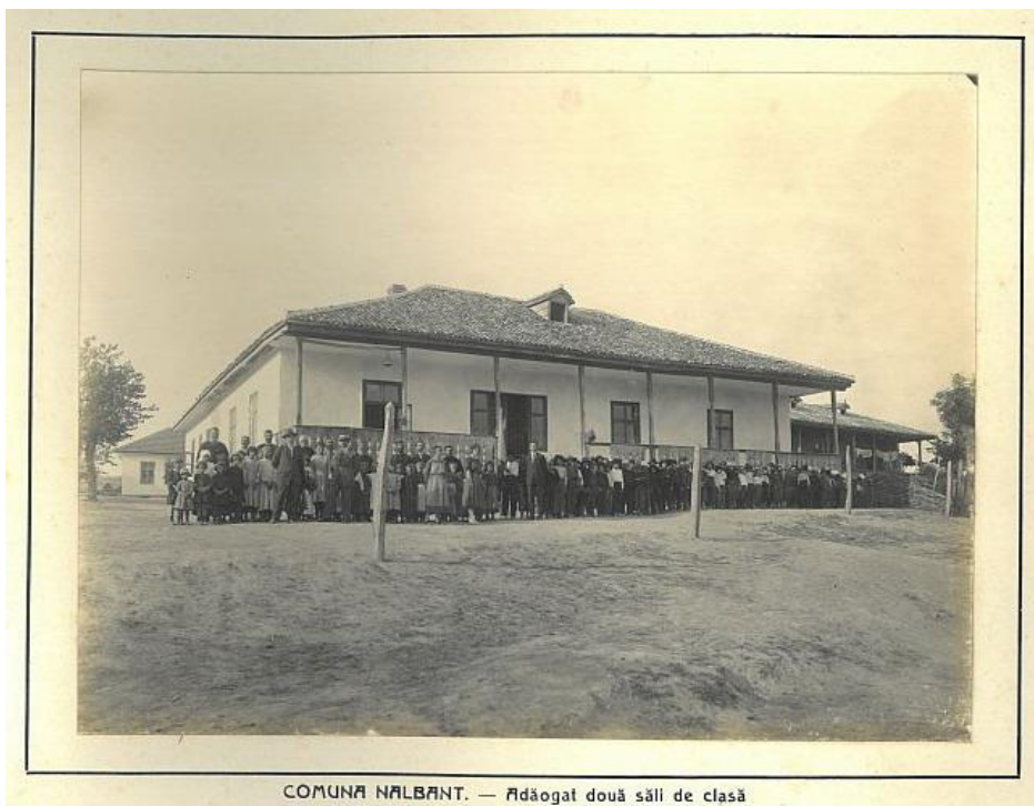
COMUNA NALBĂNT. — Adăogat două săli de clasă

Apud Localuri de școli clădite din nou și restaurate în anii 1922, 1923, 1924 în județul Tulcea [Album], Tulcea, 1925 (fără paginație)