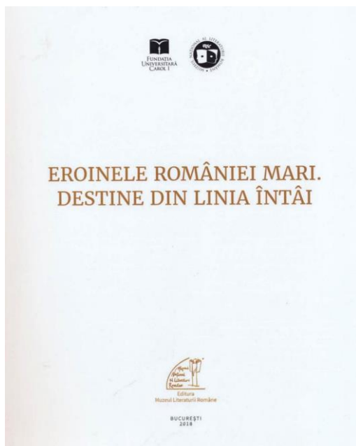
Pagina de titlu