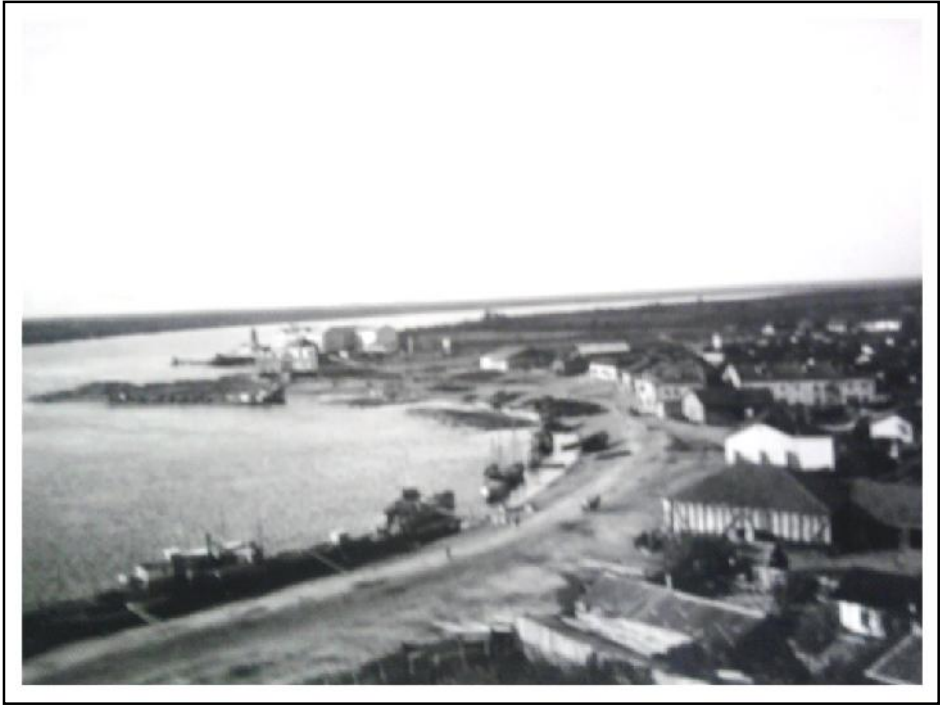
Tulcea. Portul. Vedere laterală ( apud Const. A. Cristofor, Monografia Județului Tulcea , 1938)