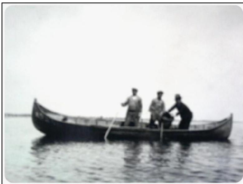
Lansarea icrelor de șalău în ghiolul Lazăr ( apud Const. A. Cristofor, Monografia Județului Tulcea , 1938)