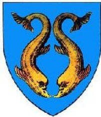
Fig. 4 – Stema Dobrogei.