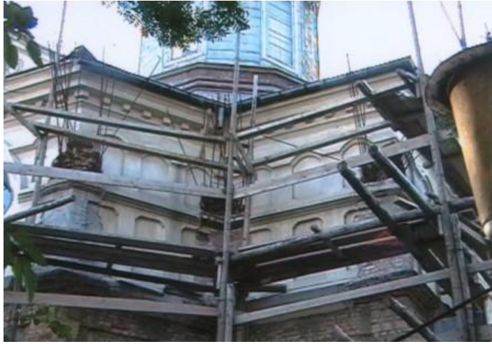
Fig. 2. Biserica „Sf. Nicolae” în timpul ultimei restaurări.