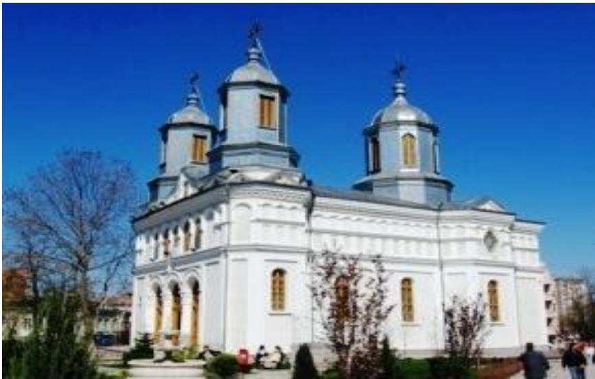
Fig. 3. Biserica „Sf. Nicolae” în prezent.