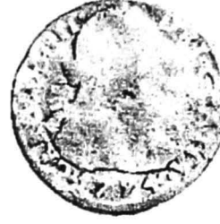
18. nr.inv. 54781