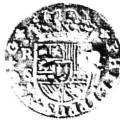
14. nr.inv. 31033