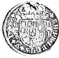
12. nr.inv. 62086