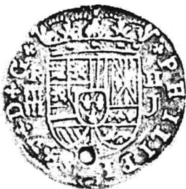
9. nr.inv. 62089