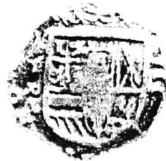
6. nr.inv. 31382