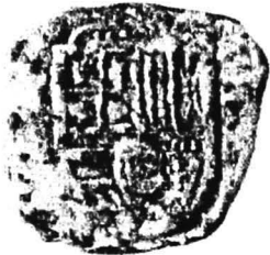
5. nr.inv. 31646