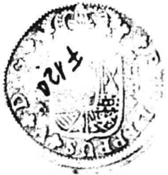
13. nr.inv. 31032