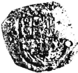
7. nr.inv. 31648