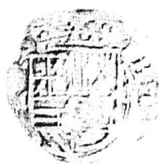
2. nr.inv. 31209