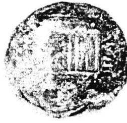
4. nr.inv. 31208