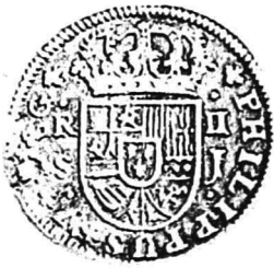
11. nr.inv. 62087