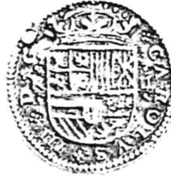
16. nr.inv. 62091