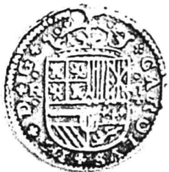
17. nr.inv. 62088