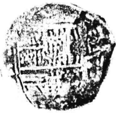
1. nr.inv. 31203