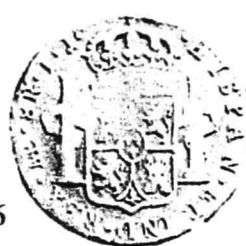
Plansa II. Monede spaniole din colecția numismatică a Muzeului Național de Istorie și Arheologie Constanța. Planche II. Monnaies espagnoles de la collection numismatique du Musée National d'Histoire et d'Archéologie de Constantza