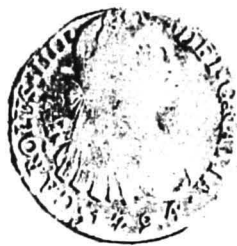
19. nr.inv. 54686