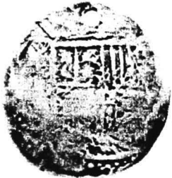
3. nr.inv. 51237