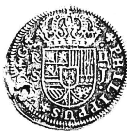
10. nr.inv. 62090