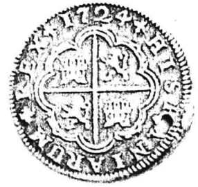
Plansa I. Monede spaniole din colecția numismatică a Muzeului Național de Istorie și Arheologie Constanța.