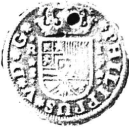
15. nr.inv. 54681