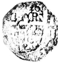
8. nr.inv. 31181