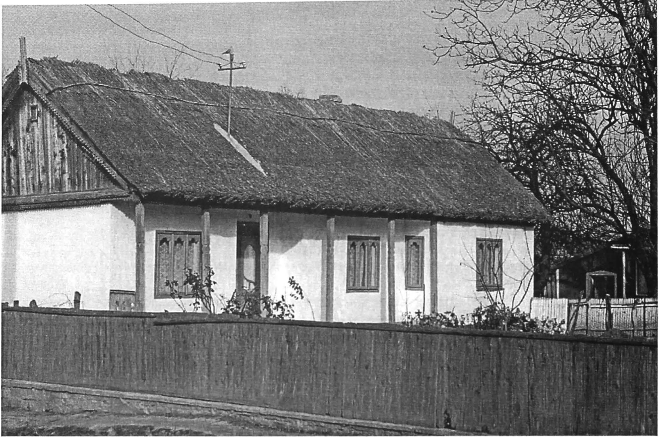
Figura 1. Casă românească cu planimetrie tradițională, microzona lacului Razim, jud. Tulcea. Figure 1. Romanian house with traditional planimetry, Razim Lake microzone, Tulcea County.