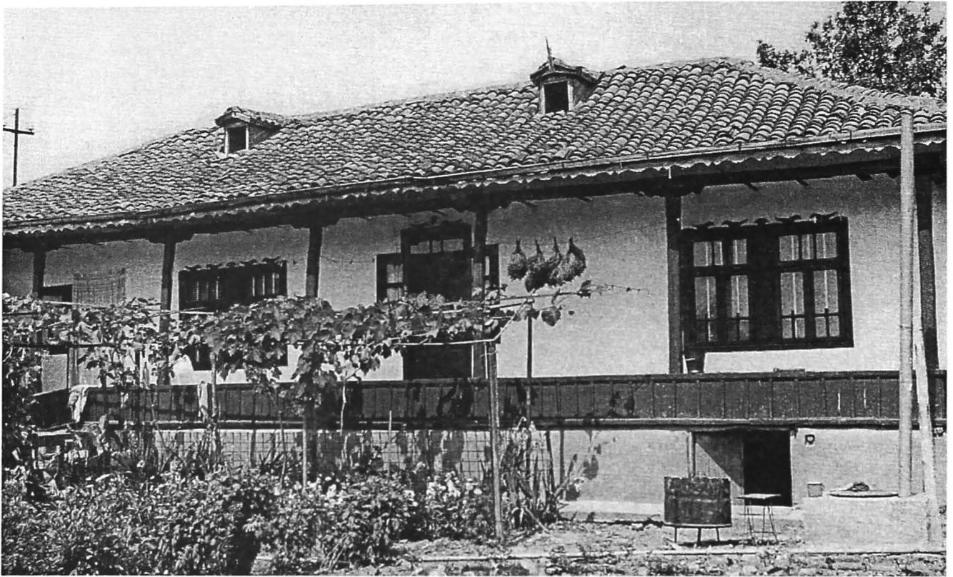
Figura 5. Casă cu planimetrie tradițională și cu unele elemente de influență balcanică (streașină largă, beci dedesubtul casei, temelie înaltă), Izvoarele, jud. Tulcea. Figure 5. House with traditional planimetry having certain elements of Balkan influence (wide eaves, cellar placed under the house, high foundation), Izvoarele, Tulcea County.