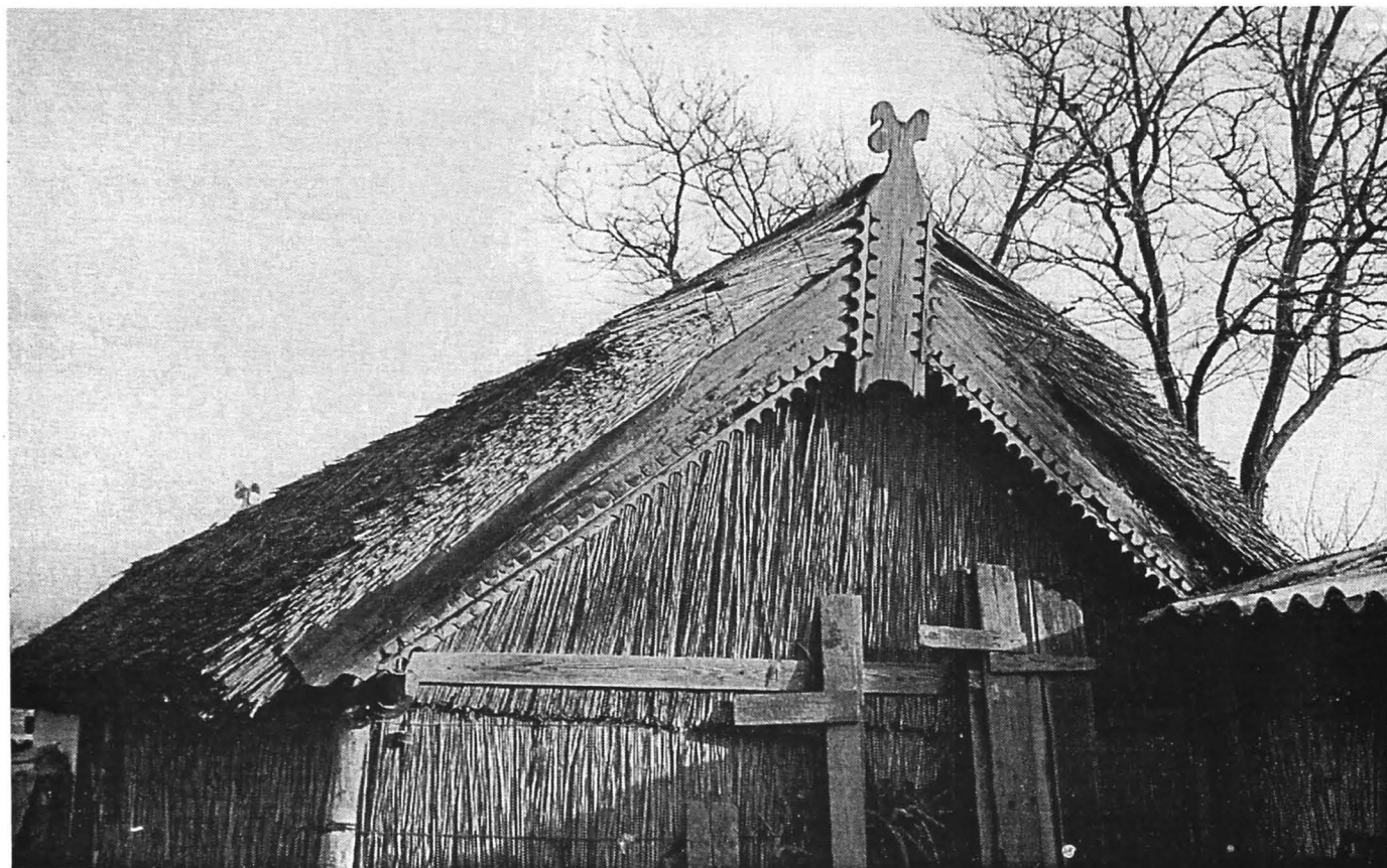
Figura 3. Timpan din stuf al unei anexe gospodărești, microzona lacului Razim, jud. Tulcea. Figure 3. Thatched gable belonging to a household annex, Razim Lake microzone, Tulcea County.