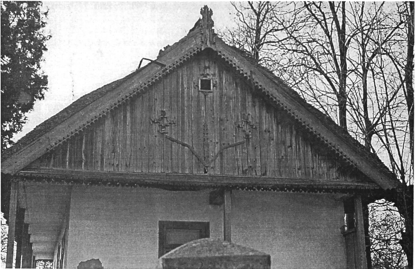
Figura 2. Fronton din lemn cu motive decorative tradiționale, microzona lacului Razim, jud. Tulcea. Figure 2. Wooden gable with traditional decorative motifs, Razim Lake microzone, Tulcea County.