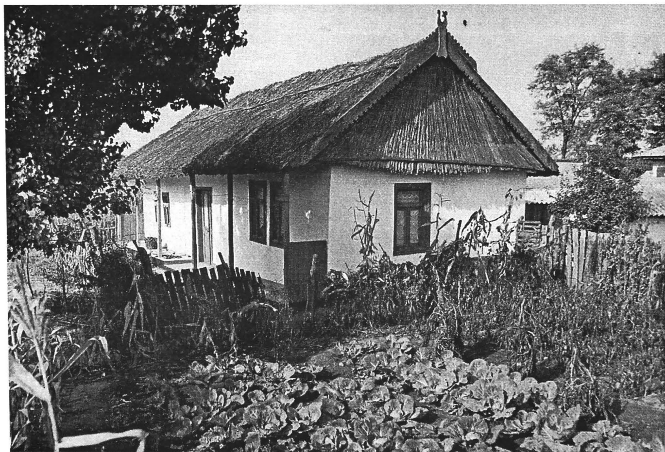
Figura 4. Casă românească cu planimetrie tradițională, microzona lacului Razim, jud. Tulcea. Figure 4. Romanian house with traditional planimetry, Razim Lake microzone, Tulcea County.