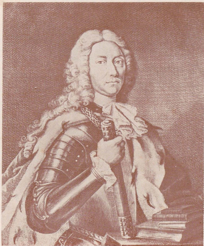
Dimitrie Cantemir 1673—1723