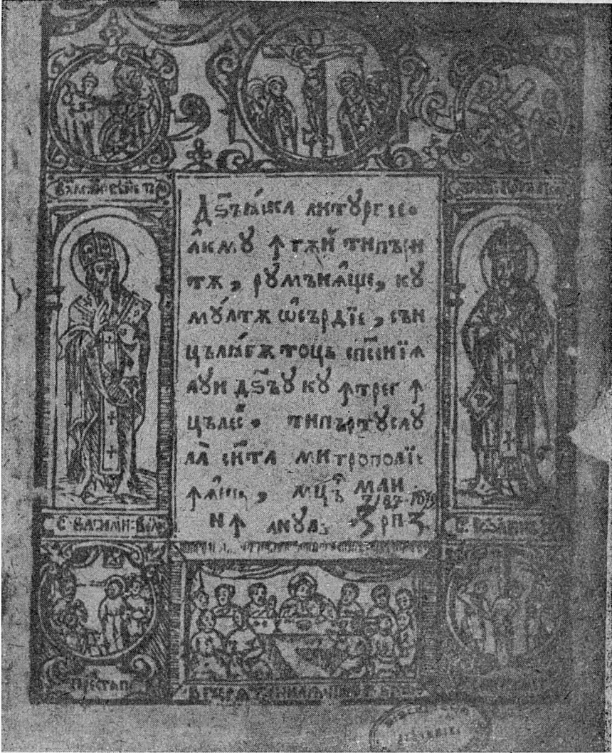
Fig. 6. Dumnezeasca liturgie (1679) — Dosoftei C. V. rom. 69