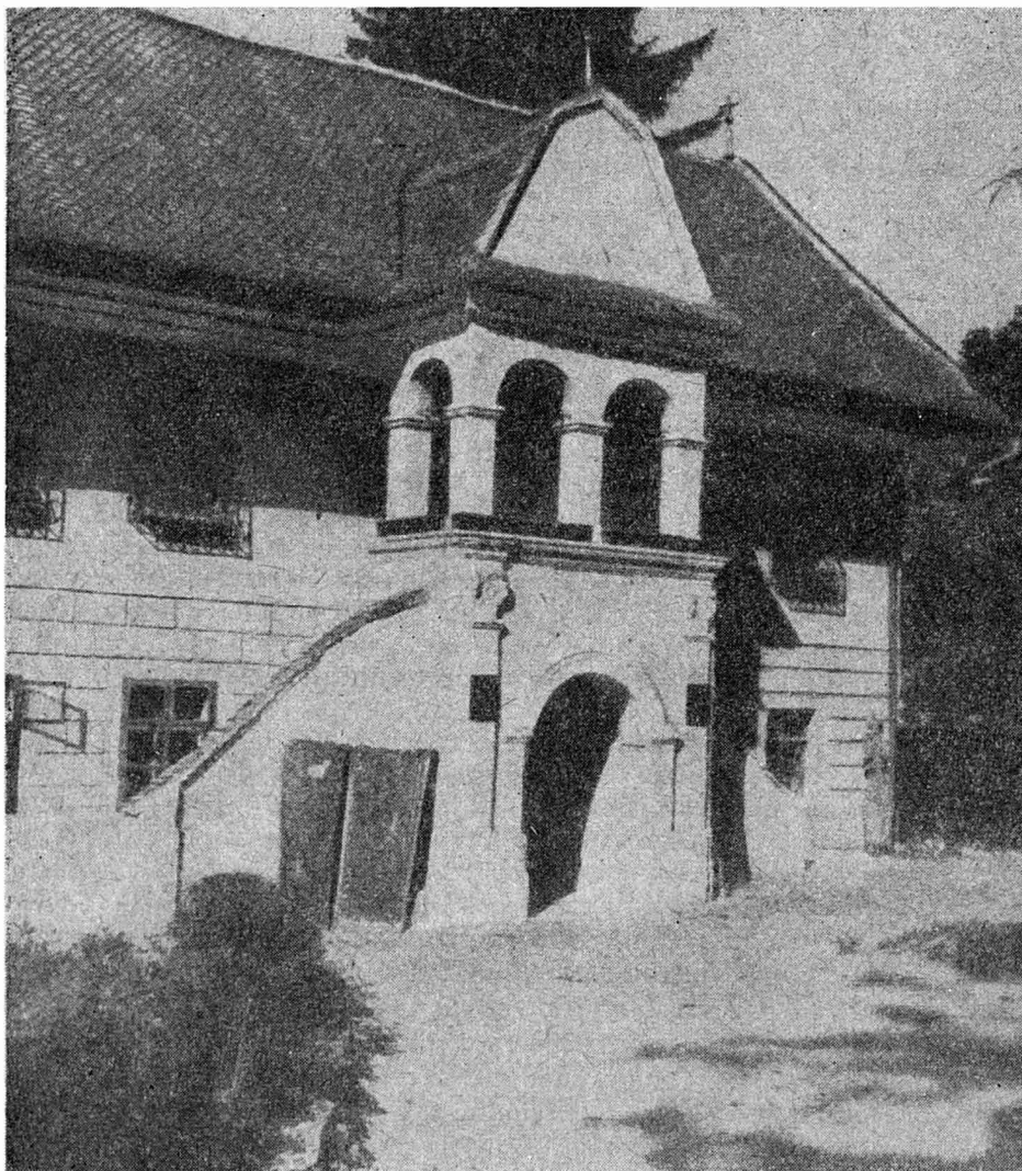
Fig. 3. Vechea școală românească din Șcheii Brașovului (probabil sediul tipografiei lui Coresi).