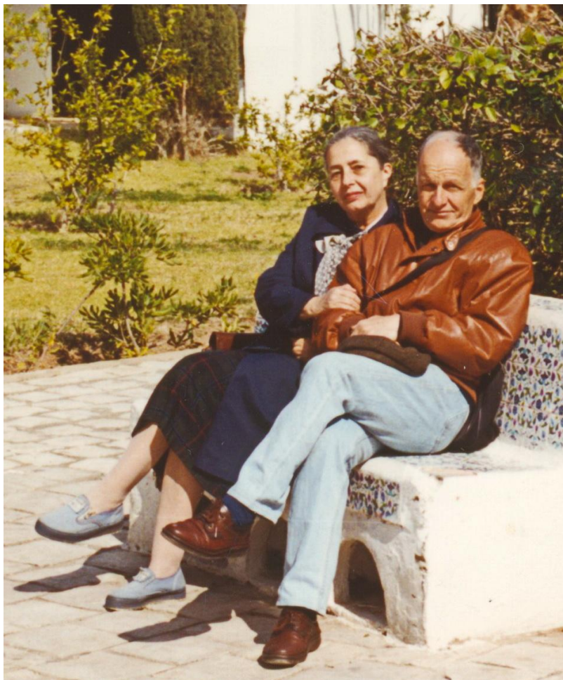
Cu Tanța, în excursia din Portugalia, 1993.

căutam, se înșirau blocuri modeste, de 3-4 nivele, cu tencuiala scorojită, cu balcoanele încărcate de rufe întinse la uscat - contrastând izbitor cu clădirile învecinate.