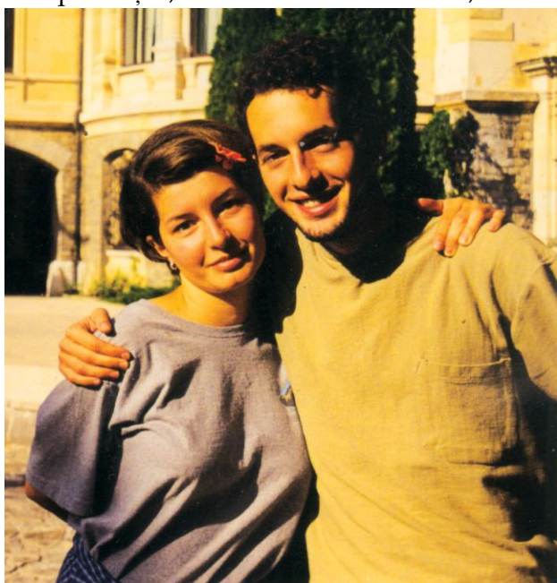
... și, câțiva ani mai târziu, în curtea Castelului Peleş.