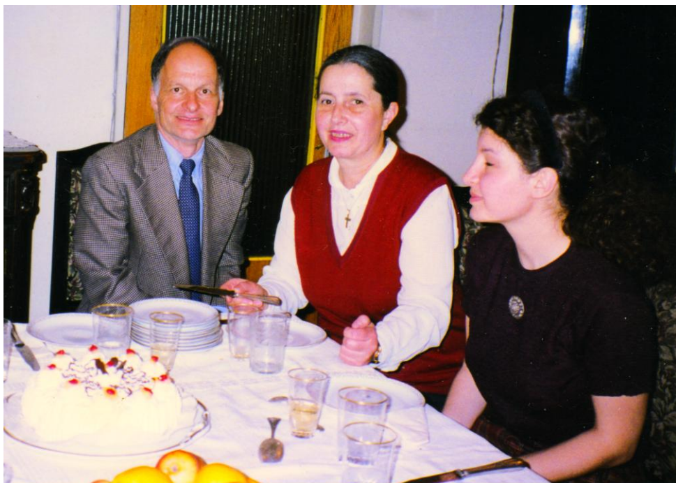
Cu Tanța și Ilinca, pregătind servirea tortului pentru o masă cu prieteni francezi.

Odată cu anii și cu problemele de sănătate, ne-am retras, treptat, din forma activă a vieții de club. Pe măsura schimbului inerent de generații, nu știu ce mai dăinuie azi din fervoarea acelor acțiuni, desfășurate cu egală energie și dorință de a face bine, de către membrii fondatori cu care pornisem, inițial, la drum.