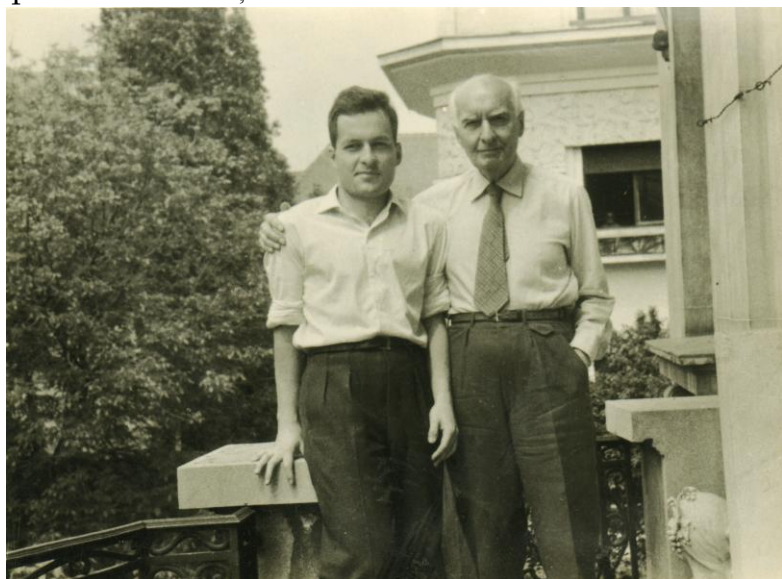
Cu tatăl meu, pe terasa casei din Bd. Dacia, 1963.

Moștenirea lăsată de părinți nu s-a pierdut odată cu aceasta. Inelul ei gravat cu numele meu mi-a fost dat în momentul închiderii coșciugului. Ea știe asta și, de aceea, „casa de piatră” pe care am clădit-o împreună rămâne și acum neclintită.