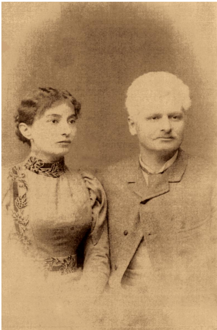
Bunicii paterni, Galați, 1889.

Pe parcursul a 15 ani din căsnicia lor s-au născut 10 copii, dintre care patru băieți, primul dintre aceștia, în 1851, fiind bunicul meu, Dumitru Iurașcu.