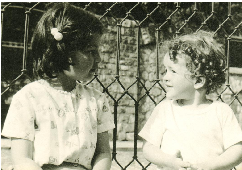
Copiii noștri, în curtea casei din Sinaia, 1980.