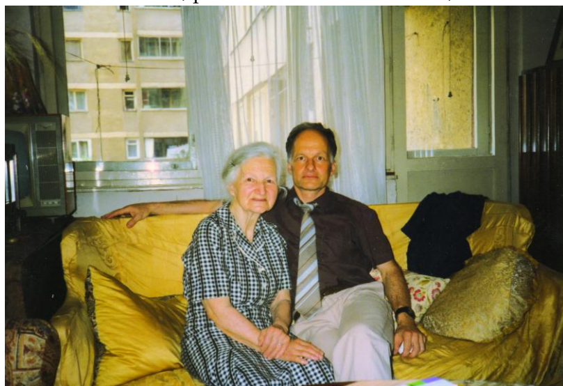
Cu mama mea, în apartamentul din Bd. Tineretului, 1992.