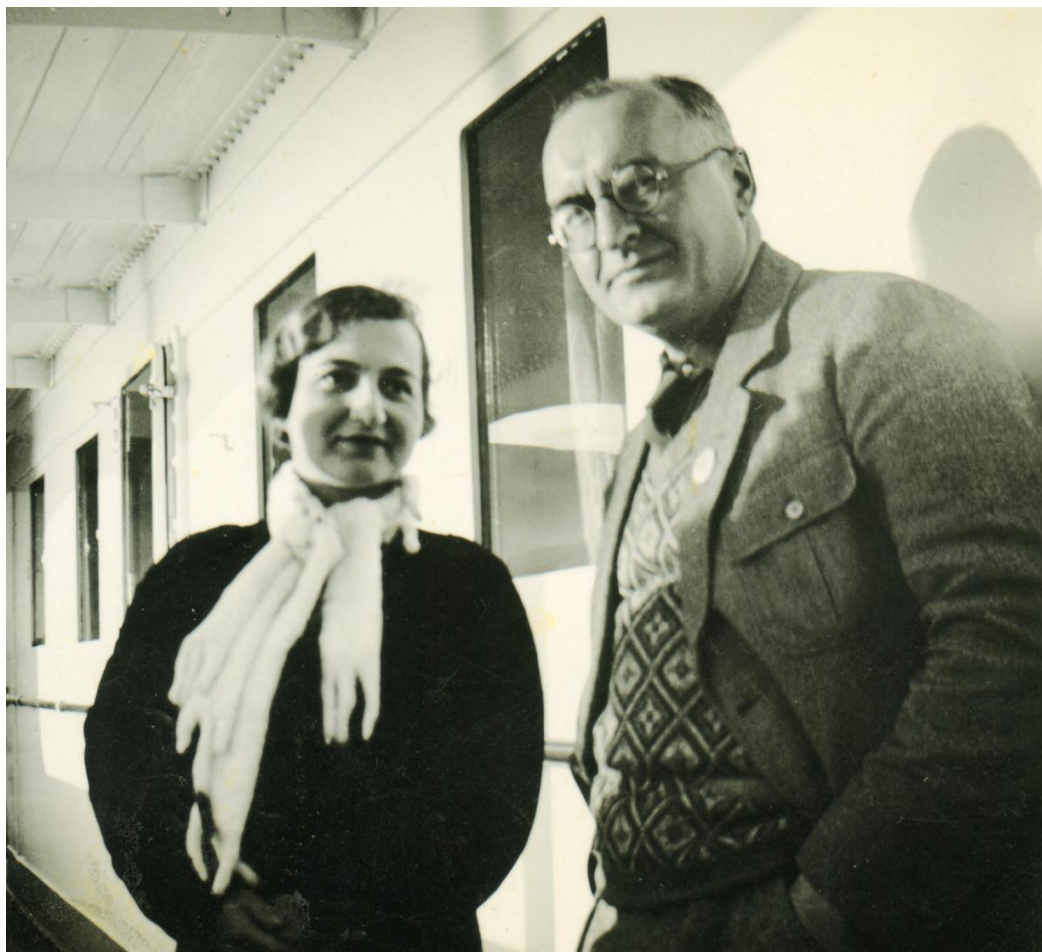
Părinții mei, în croazieră spre Capul Nord, Norvegia, 1935.