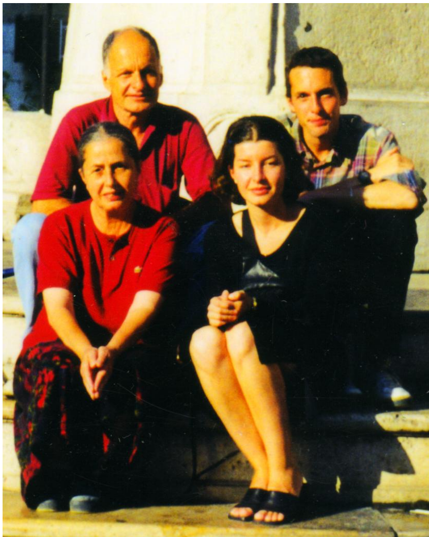
Cu copiii noștri, la încheierea unui periplu european, Budapesta, 2000.

Dar coada și interogatoriile făceau parte de mult din gena noastră, așa că măcar acum ne supuneam de bună voie și cu zâmbetul pe buze. De unde, de ne-unde, în apropiere, au apărut dughene improvizate, unde găseai, la orice oră, cafea fierbinte, la pahare din plastic, o chiflă cu salam sau ȱigări, ca și încă omniprezenta sticlă de Cico. Tot binevenite au fost cabinele de WC, pentru atâta mulțime de popor stând înțepenită, cu ceasurile, în lungul trotuarului, spre