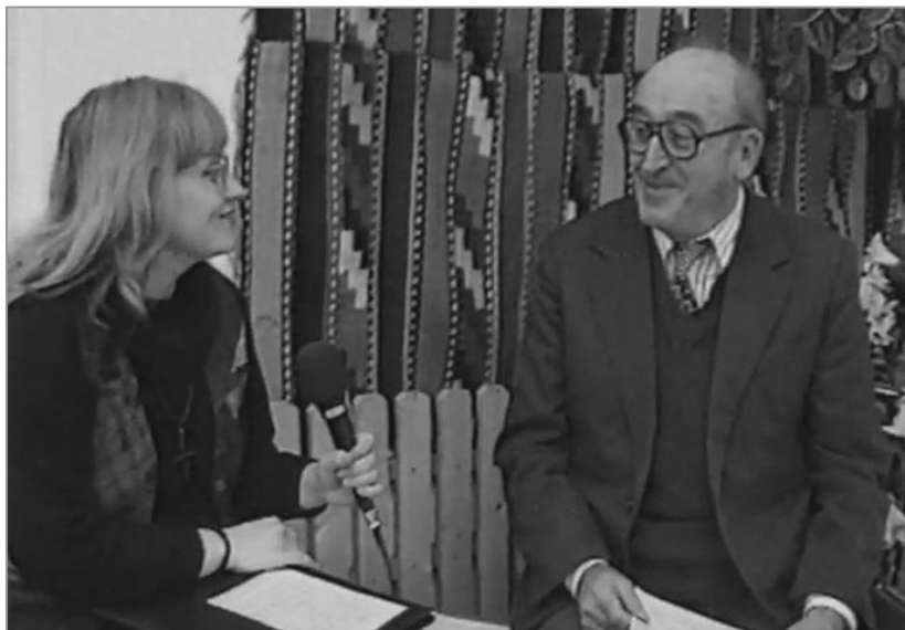
Imagine din emisiunea despre satele Cervenă, Conțești și Calomfirești (martie 2001).