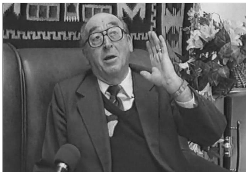
Imagine din emisiunea despre satele Călinești, Dracea, Furculești, Fântânele și Lăceni (aprilie 2001).