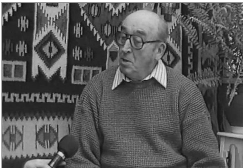
Imagini din emisiunea despre satele Adămești, Albești-Dulceanca, Antonești și Atârnați (ianuarie 2001).