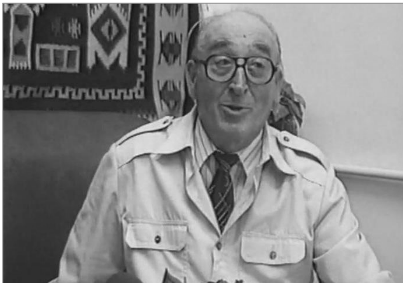
Imagine din emisiunea despre satele Frumoasa, Lița și Licuriciu (mai 2001).