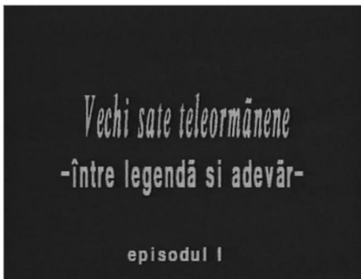
Genericul emisiunii „Vechi sate teleormănene între legendă și adevăr”, difuzată între 2001-2002, în cadrul ciclului „Oameni, locuri, amintiri...”