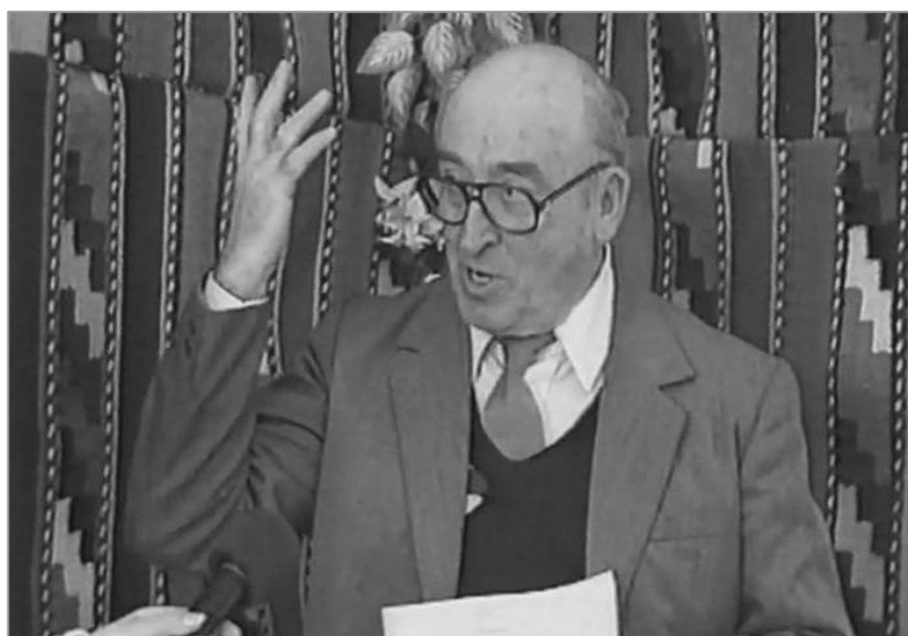
Imagini din emisiunea despre satele Brânceni, Buzescu, Bivolita și Bragadiru (februarie 2001).