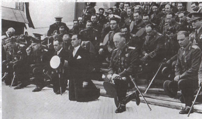
Generalul Ion Antonescu, împreună cu Mihai Antonescu (stânga) și ofițeri, în timpul unei slujbe religioase

„Am rezistat și următoarele luni, iar la sfârșitul lui martie, ne-am retras pentru refacere, între orașele Kertsch și Feodosia, ajungând apoi la Simferopol și Sevastopol. Din urmă am fost ajunși de alte coloane, disperate, de la care am aflat că trupele sovietice au debarcat pe litoralul Mării de Azov și că au rupt frontul la gâtul Perekop, încercuit astfel trupele române și germane aflate în Peninsula Kertsch, pe care le-au făcut prizoniere. Deci noi eram ultimele trupe care am scăpat din