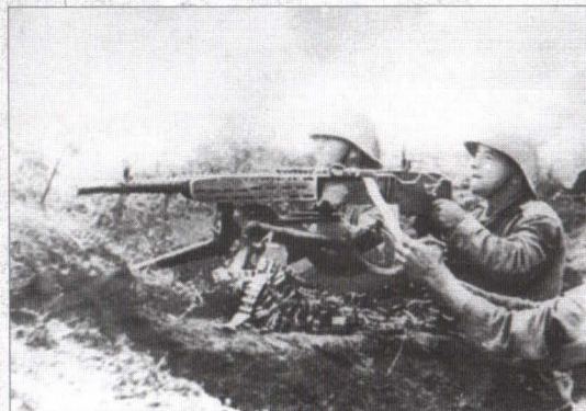
Servanți executând foc cu mitraliera ZB-53. Transilvania, octombrie 1944