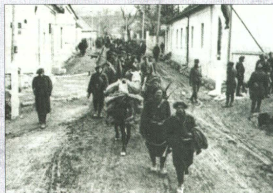
Vânători de munte în Cehoslovacia în aprilie 1945. Soldații poartă băștile caracteristice armeei

MARAMUREȘUL ȘI CEL DE-AL DOILEA RĂZBOI MONDIAL