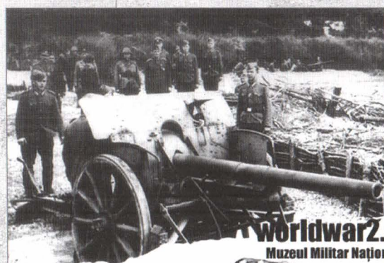
Generalul Pantazi inspectează poziții de artilerie pe frontul de est

„Vă cerem să depuneți tot armamentul cu care sunteți dotați și veți fi ajutați de către partizani să vă procurați haine civile și cele necesare până la hotarele unde doriți să mergeți. Vă dăm timp de gândire 30 de minute. Vreți libertate sau vărsare de sânge”.