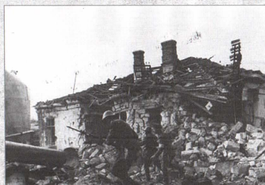
Soldați români în timpul bătăliei de la Odessa