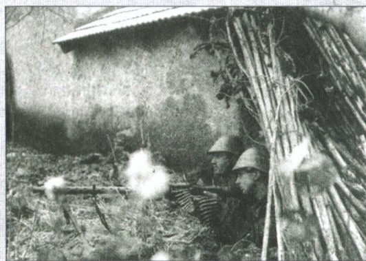
Cuib de mitralieră MG-34