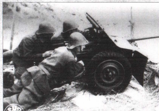
Tun anticar Bofors al trupelor de cavalerie. Capul de pod Taman, mai 1943.