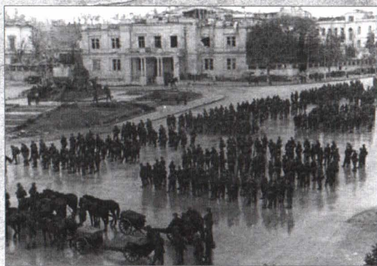
Soldati români în Sevastopol

Este ora 7.30. Apar trei militari inamici înarmați, și anume doi soldați și un sergent. Ei vin spre noi, fără să ne observe. Îi lăsăm să se apropie la distanța de 8-10 m, când i-am somat. Ei s-au oprit. Atunci i-am întrebat, în limba maghiară, dacă fac parte din bateria respectivă. Ni s-a răspuns: „da, fac parte din efectiv”. Îi somez să depună armele și să comunice comandamentului de baterie să vină până la noi pentru unele informații. Ne-au răspuns că sunt de acord să-l anunțe, dar nu sunt de acord să depună armele. Le-am explicat pericolul în care se află, fiind încercuiți și faptul că noi am venit să-i eliberăm și astfel să poată scăpa cu viață și să ajungă la casele lor. Atunci au înțeles și au depus armele, după care au plecat la comandantul lor. Am așteptat. După 40 de minute a apărut comandantul în fruntea a 21 ostași, 2 ofițeri, 2 subofițeri, 2 adjutanți plutonieri majori cu care se apropia de noi. La distanța de 10 m i-am