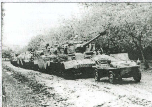
Coloană de blindate în Transilvania