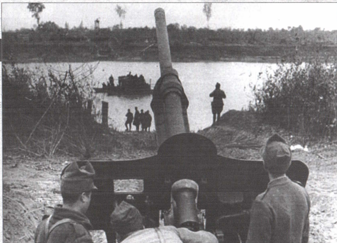
Tun calibrul 76,2 mm (capturat în timpul campaniei din est) sprijină cu foc traversarea Tisei