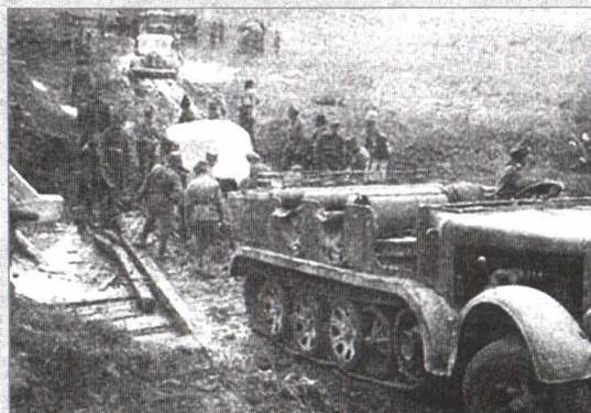
Tractor Famo ajutând la remorcarea vehiculelor împotmolite. Transilvania, septembrie 1944.