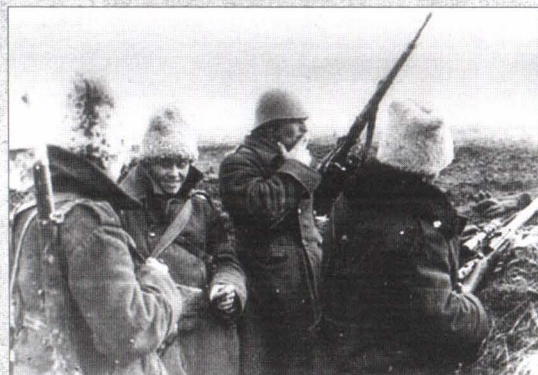
Ostași în tranșee la Cotul Donului, octombrie 1942