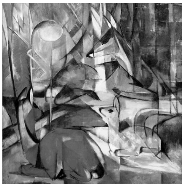
Franz Marc, Rehe im Walde