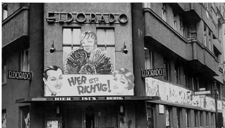
Abb. 6: El Dorado im Berlin der 1920er Jahre.