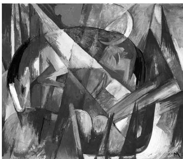
Franz Marc, Fabeltier II