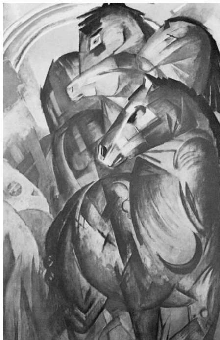
Franz Marc, Turm der blauen Pferde