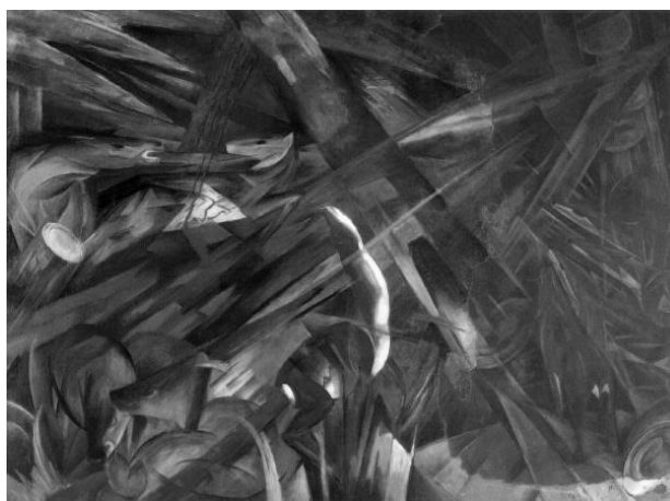
Franz Marc, Tierschicksale: die Bäume zeigen ihre Ringe, die Tiere ihre Adern