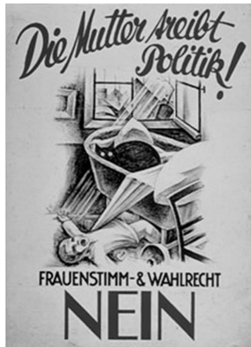
Abb. 5: Die Mutter treibt Politik!

Politisch konservative Kräfte sahen in der politischen Betätigung von Frauen eine Gefahr für die Kinder von Müttern, die „Politik treiben“: