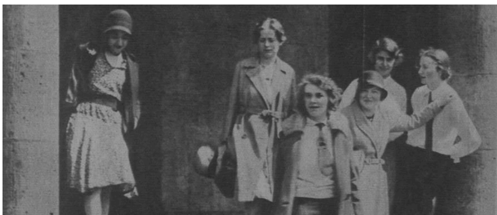
Abb.1: Frauen in der Weimarer Republik

Bevor im Folgenden einzelne Aspekte der Weimarer Republik im Hinblick auf die Geschlechterverhältnisse dargelegt werden, hier einige bildliche Eindrücke aus der Zeit der Weimarer Republik: