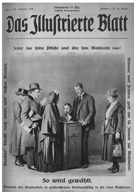
Abb. 4: So wird gewählt.

die heirateten, mussten ihren Beruf aufgeben. Hatten Lehrerinnen 1919 das Recht erhalten, zu heiraten, dann mussten sie ab 1923 ihren Beruf bei Verheiratung wieder aufgeben. 16 Unverheirateten Lehrerinnen wurde eine „Ledigensteuer“ von 10% 17 abverlangt und sie verdienten weit weniger als ihre männlichen Kollegen.