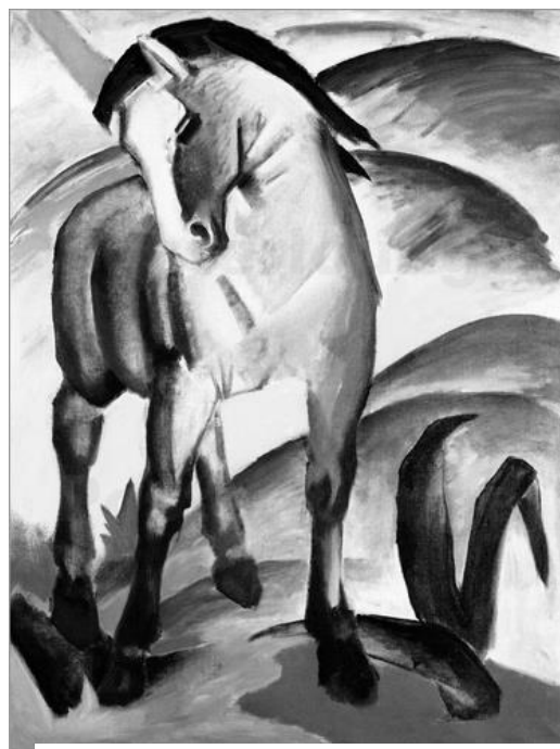
Franz Marc, Blaues Pferd