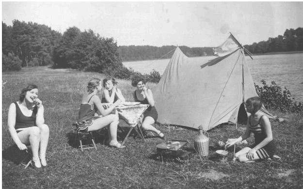
Abb. 2: Freundinnen beim Zelten um 1928.