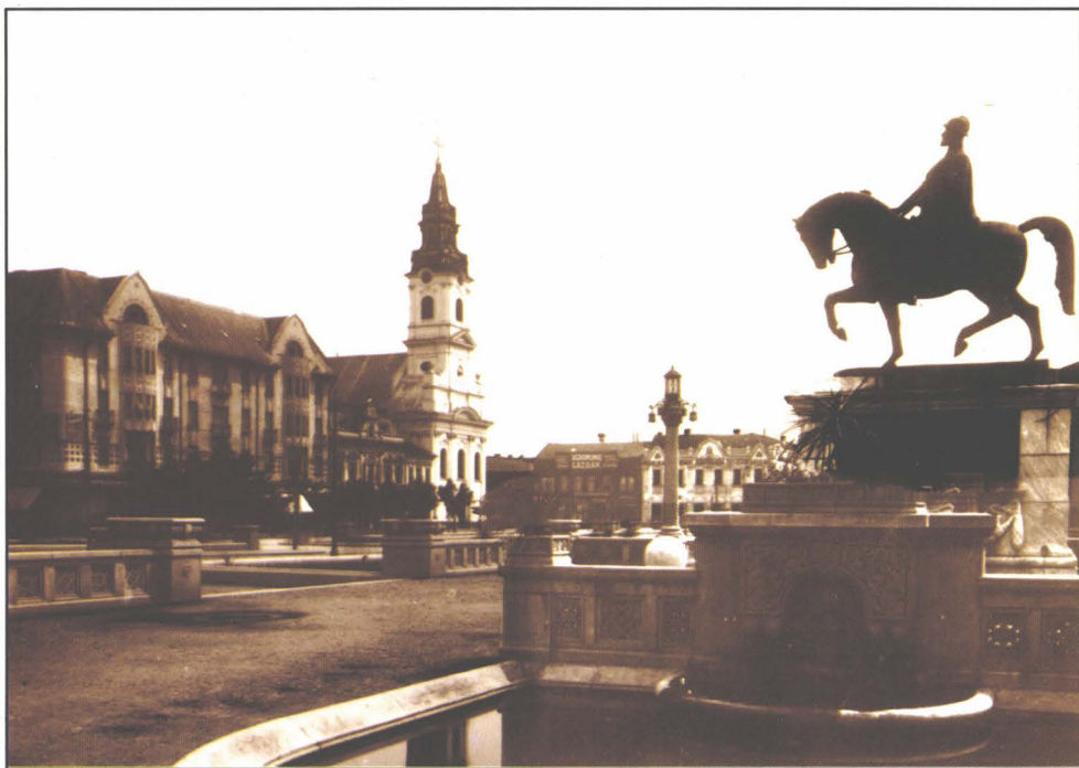
Statuia ecvestră a Regelui Ferdinand I din Piața Centrală a orașului Oradea (perioada interbelică)