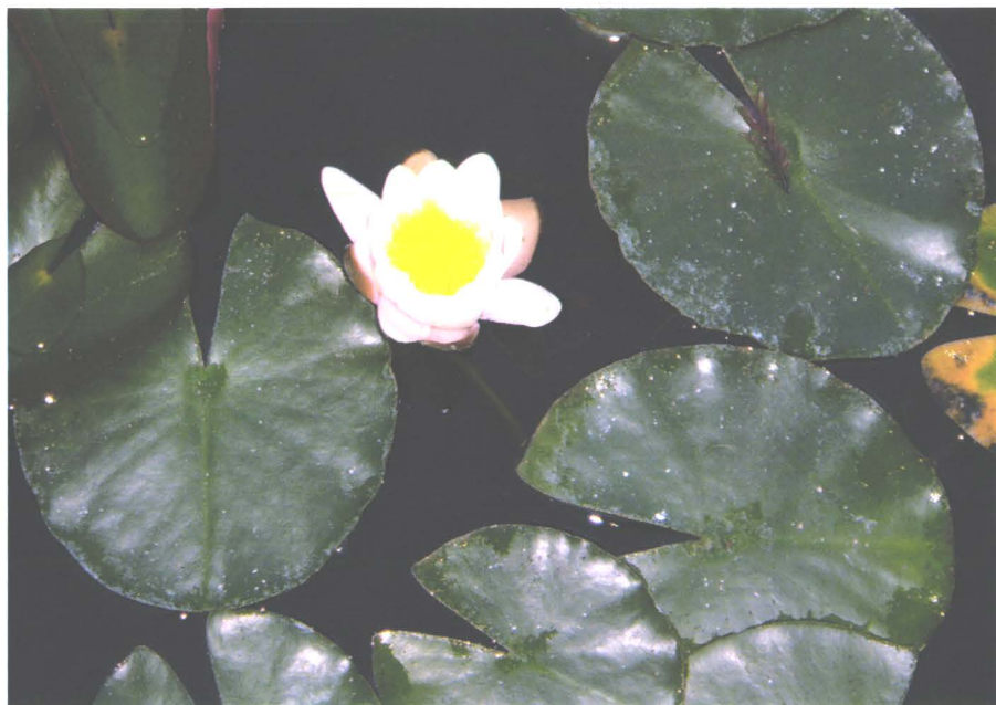
Nufărul de la Băile Felix (decembrie 2006)