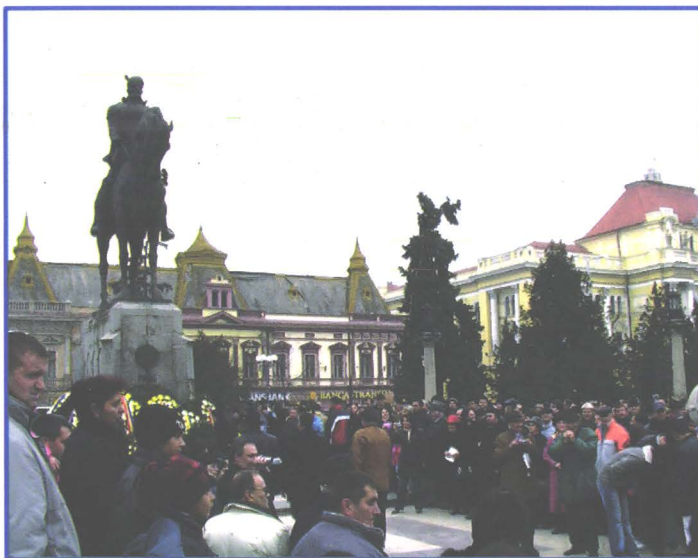
Depunere de flori la Statuia lui Mihai Viteazul din Oradea (1 Decembrie 2006)