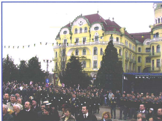
Participanți la evenimentul din 1 Decembrie 2006, din Piața Unirii (Oradea)