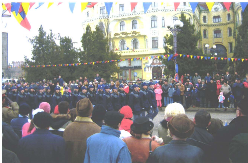
1 Decembrie 2007 - manifestare din Piața Unirii (Oradea)