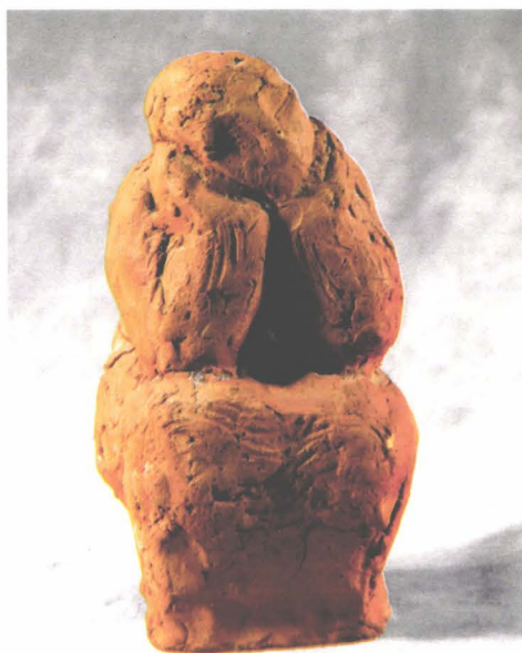
Bunica (de Fekete Jozsef)