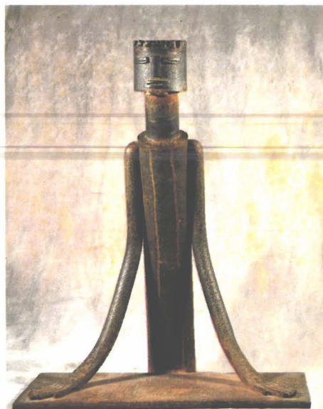
Portretul "Directorului" (de Fekete Jozsef)