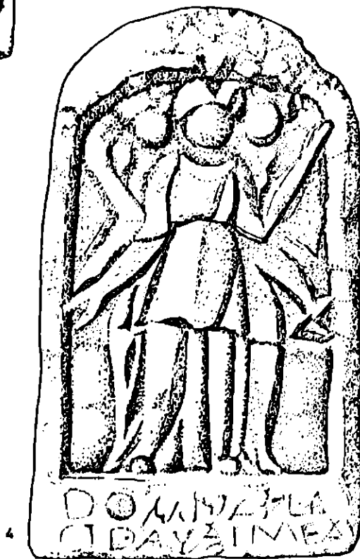
Fig.2. - Reliefuri votive descoperite la Drobeta (1), Romula (3) și Cioroiu Nou (4); relief mitriac din Oltenia (2).