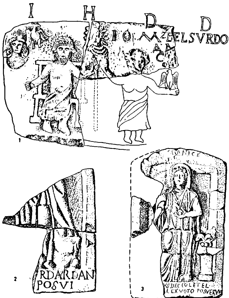
Fig.3. - Basorelief de calcar descoperit la Drobeta (1). Reliefuluri votive înfățișând pe Dea Dardanica descoperite la Romula (2-3).