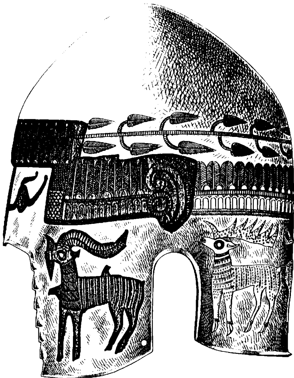
Fig.1.- Peretu, cască de argint aurit.