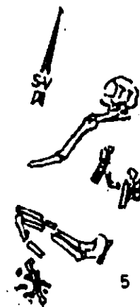
Pl. I. - 1 - vas sarmatic descoperit în M 1 ; 2-5 - M I-IV.