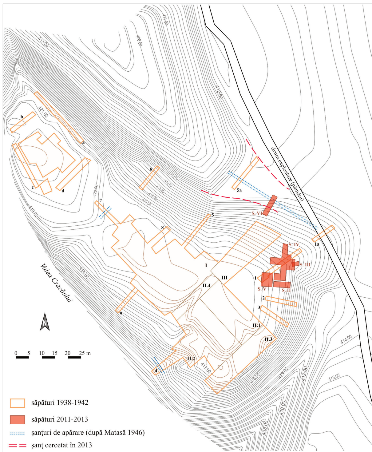
Planșa I. Bodești - Cetățuia Frumușica. Planul săpăturilor.