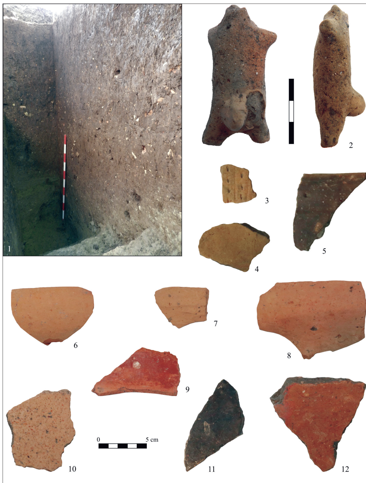
Planșa IV. 1. Detaliu al profilului de sud-est; 2. figurină antropomorfă getică; 3-12. ceramică descoperită în umplutura șanțului: (3-5. epoca bronzului; 6-8. Cucuteni B; 9-12. Cucuteni A).