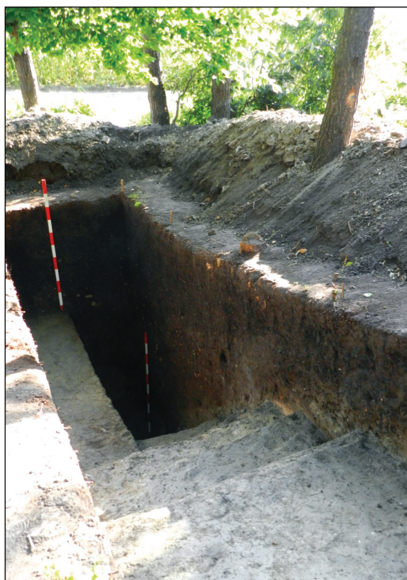
Planșa II. 1-2. Vedere asupra laturii de est a Cetățuii în anii '70 și 2010; 3-4. Șanțul de apărare intersectat în S. VI.