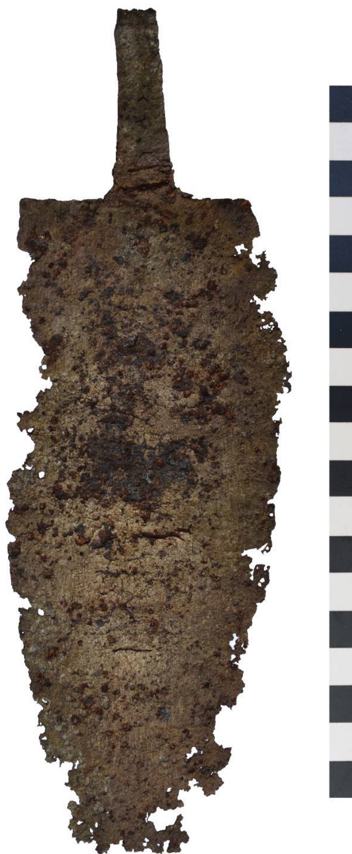
Pl. I. Pugio descoperit la Marginea Pădurii, jud. Prahova.