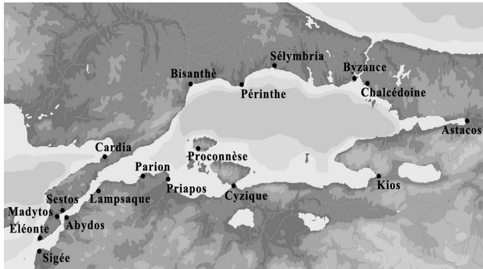
Fig. 1. Harta generală a cetăților grecești de pe țărmurile Hellespontului și ale Propontidei (apud Robu 2012, 195).