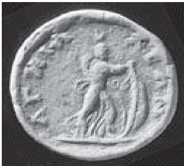
Fig. 3. Monedă de la Anchialos de tipul „Isis cu velă”, apud Bricault 2006, 60, fig. 21.