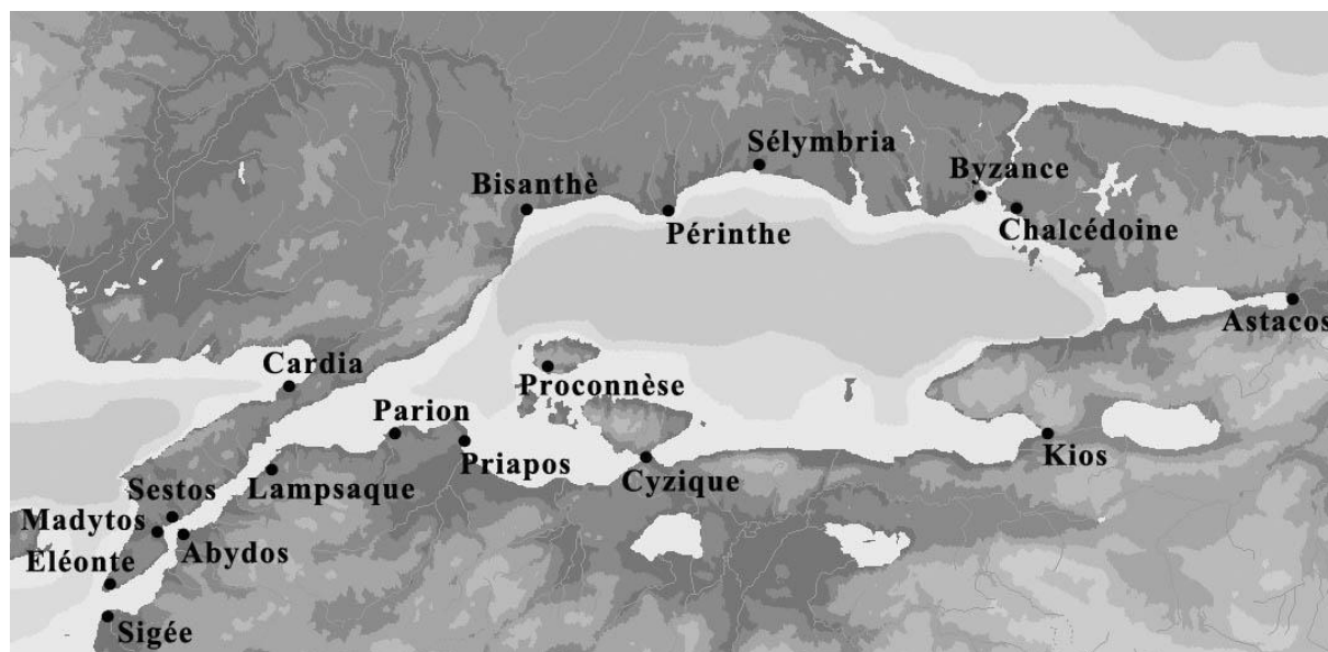
Fig. 1. Harta generală a cetăților grecești de pe țărmurile Hellespontului și ale Propontidei (apud Robu 2012, 195).