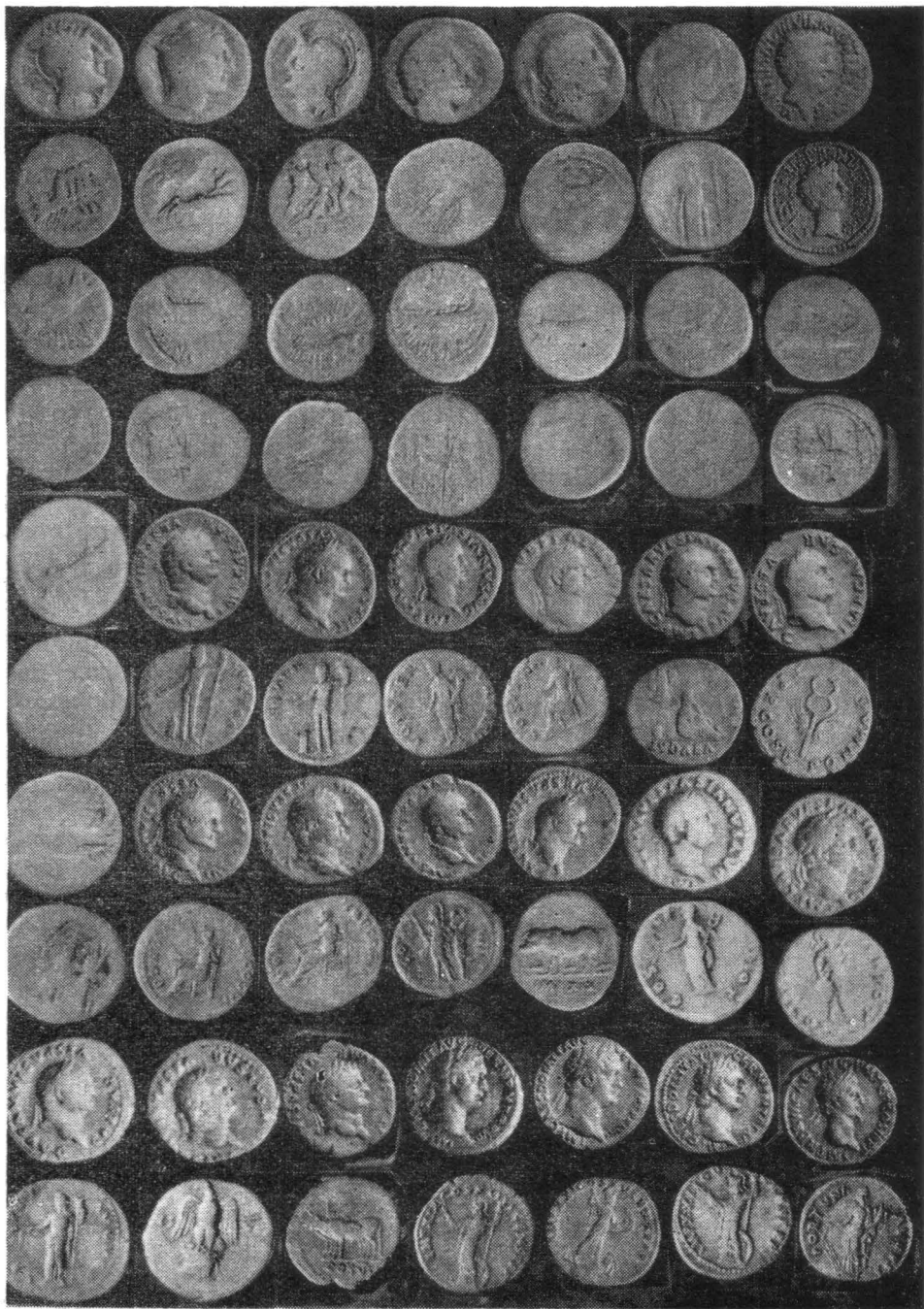
Fig. 1. Monede din tezaurul de la Dersca.