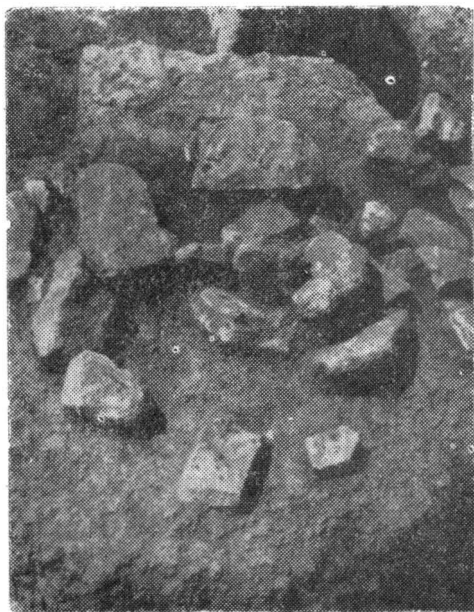
Fig. 1 – Vatra locuinței nr. 6.