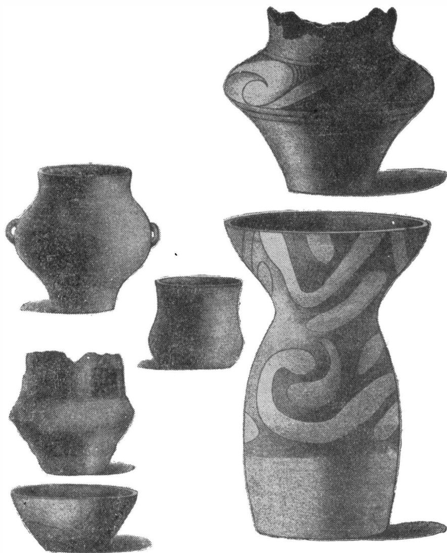
Cîteva din expozatele vechiului muzeu ieșean : ceramică neolitică