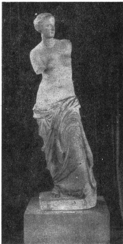
Venus din Milo de Praxiteles