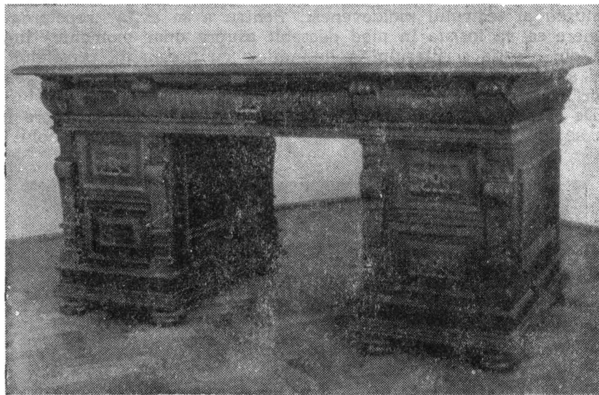
Biroul de lucru al lui Vasile Pogor