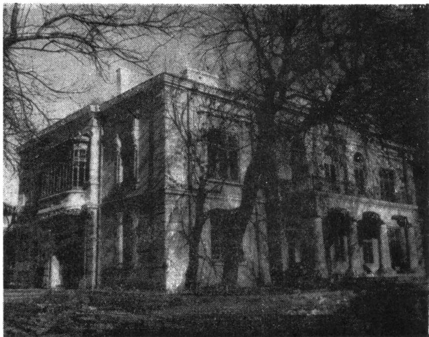
Casa „Vasile Pogor” din Iași, fostul sediu al Societății literare „Junimea”

nunt, cu orice fel de mijloace, istoria literaturii române, ci transpunerea vizitatorului în atmosfera epocilor respective.