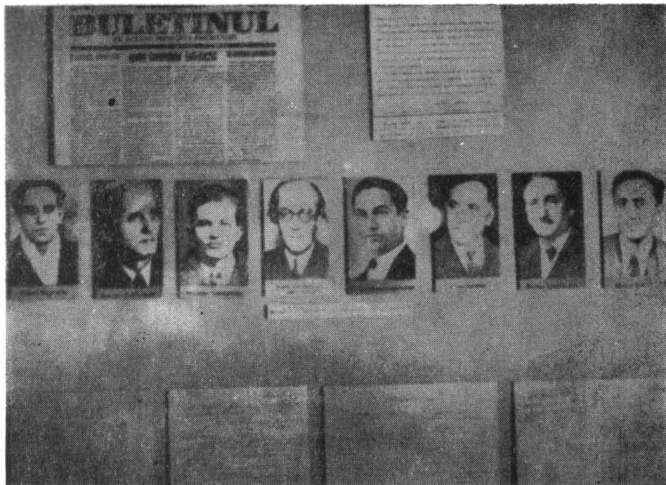
Materiale documentare care oglindesc aspecte din lupta antifascistă

O fotografie reprezentând intrarea trupelor hitleriste în România, în octombrie 1940, este edificatoare în ceea ce privește evoluția politicii duse de dictatura militară din țara noastră și consecințele acesteia pentru poporul român.