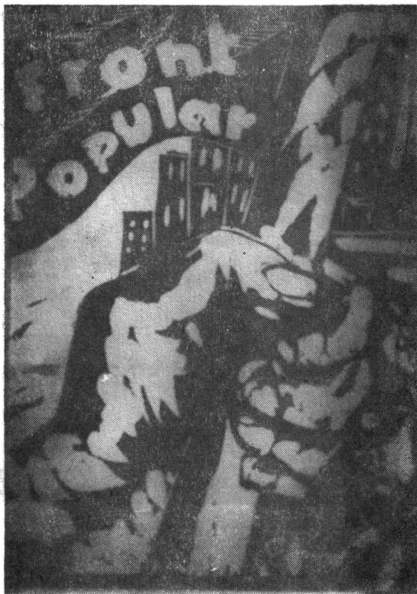
Grafică militantă din perioada premergătoare celui de al doilea război mondial.

privitoare la însemnătatea acestui epocal moment din istoria patriei noastre: „Marele act istoric de la 23 August 1944 — sublinia secretarul general al partidului — a fost rodul acțiunii unite a celor mai largi forțe politice naționale, armate, formațiunilor patriotice, al adeziunii depline la lupta antifascistă a maselor populare. În înfăptuirea acestui act de importanță crucială pentru destinele României, rolul hotărîtor l-a avut clasa muncitoare și avangarda sa revoluționară, Partidul Comunist Român“.