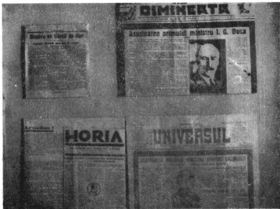
Pericolul fascist în România oglindit cu ajutorul presei

unor instalații militare, arderea portretului lui Ion Antonescu (Liceul național Iași) etc.