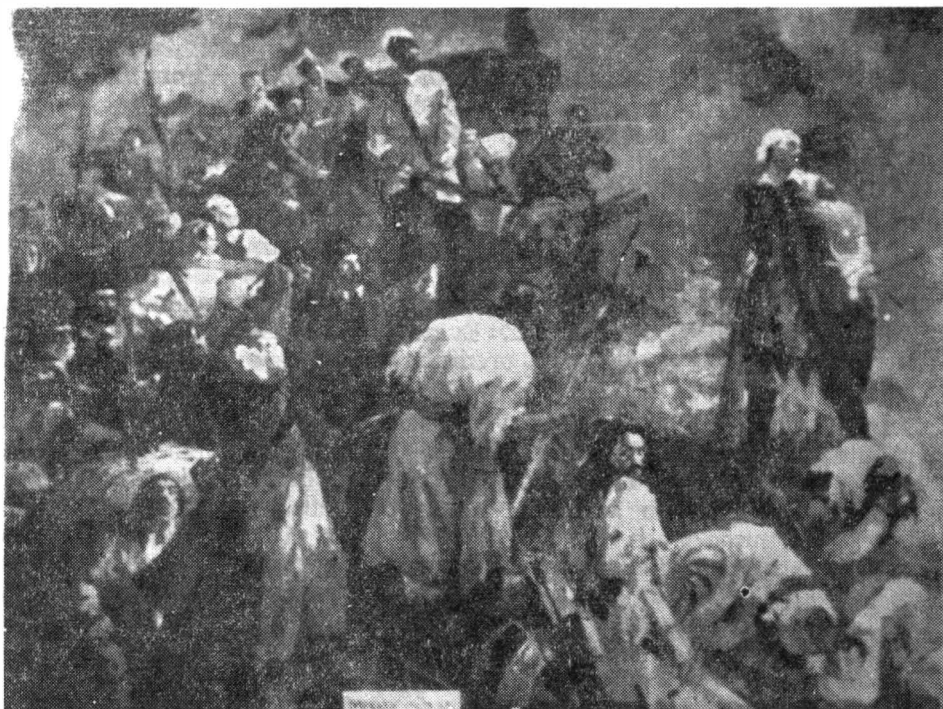
Bătălia de la Roșcani, pictură de Gh. Labin. Muzeul de istorie a Moldovei

manevrînd pe linii interioare să-și distrugă pe rînd dușmanii, adică mai întîi pe tătari și apoi pe turci 104 .