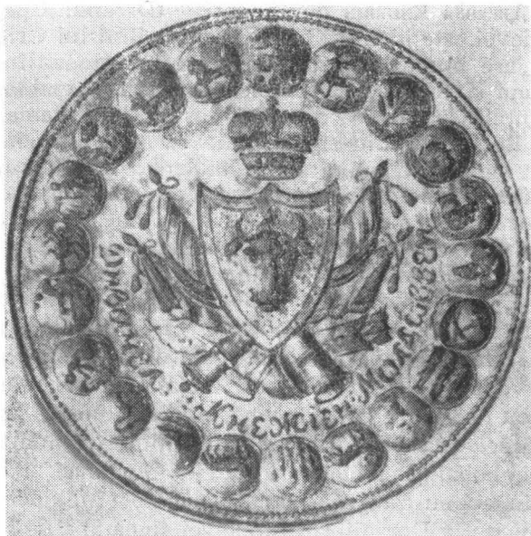
Sigiliul Divanului Principatului Moldovei de la sfârșitul sec. al XVIII-lea