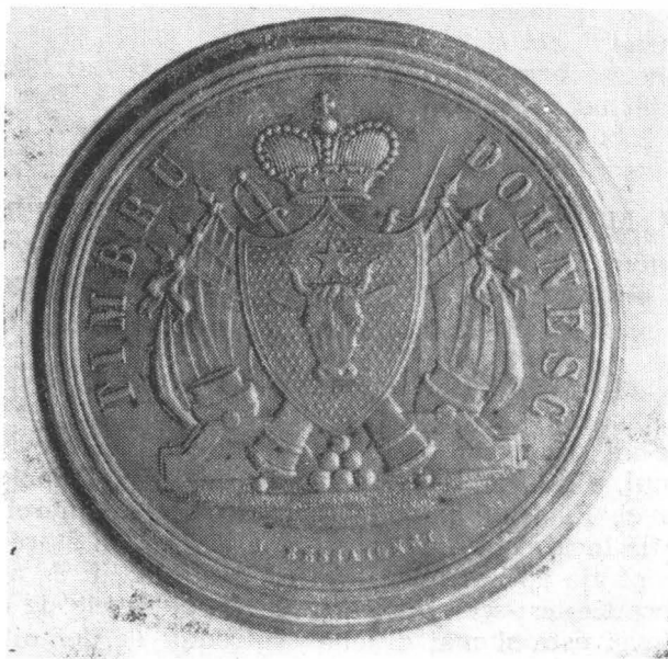
Vedere din față a sigiliului

a epocii, moldovenii și actele de guvernământ folosesc alfabetul de tranziție, sigiliul lui Grigore Al. Ghica folosește alfabetul latin.