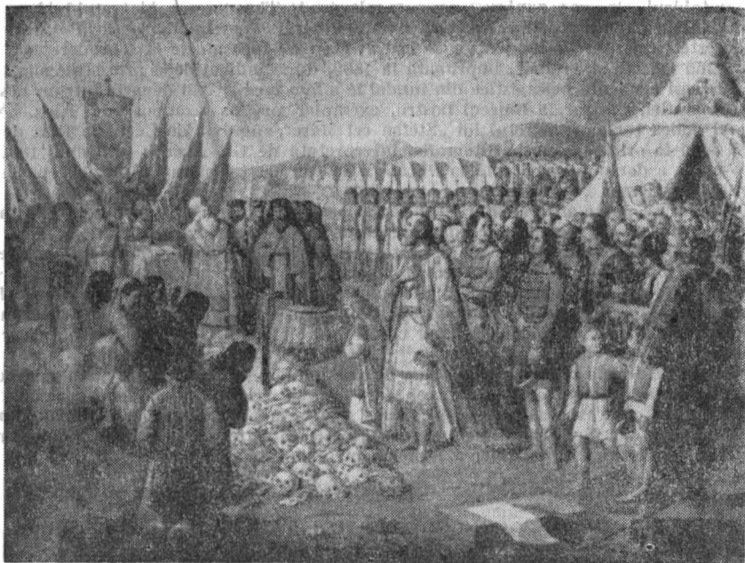
Fig. 2. Constantin Lecca. Panahida de la Răboieni.

Pictura, așa cum a definitivat-o Lecca, este cromolitografiată în același an, 1857, la Viena — prin intermediul librarului bucureștean Gh. Ioanid 9 —, iar litografia se va bucura de o largă circulație, împlinindu-și astfel rostul didactic-mobilizator, pentru care a fost gândită inițial 8 . Ținând cont și de această piesă imprimată la Viena, se poate susține că nu numai două, — cum s-a arătat pînă acum — 10 , ci de fapt trei din cele șase „tabele” cu subiect național, propuse de Asachi, în 1840, a fi multiplicare, au ajuns să vadă lumina zilei. La cel de al treilea cadru, apărut abia 17 ani mai târziu, își va aduce contribuția, (chiar dacă și fără știrea lui Asachi), într-adevăr unul din „cîi mai buni zugravi” 11 ai timpului, care era pe atunci Const. Lecca.