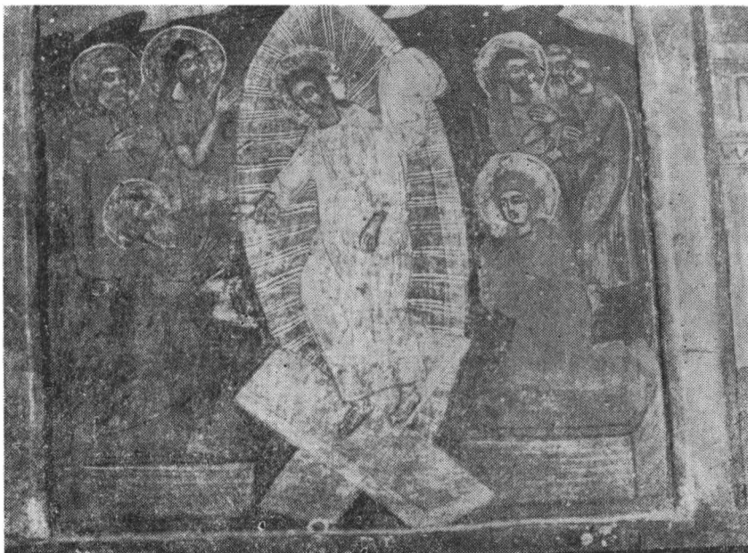
Fig. 3 – Icoana „Învierca lui Isus“