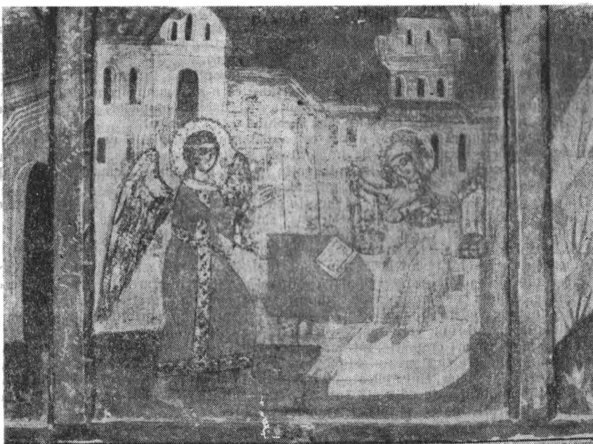
Fig. 2 — Icoana „Bunavestire“