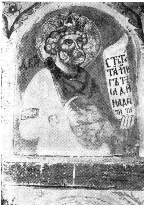
Fig. 5 — Icoana „Prorocul David“

Fantezia meșterului anonim depășește uneori cadrul restrins al modului de reprezentare. Astfel, în afara decorului cu arhitectură convențională, apar încercări de redare a peisajului, un exemplu în acest sens fiind icoana „Nașterea Domnului“ (Fig. 1), unde prin linii diagonale, ondulate, sînt sugerate dealuri cu vegetație săracă, ce repetă ca formă motivul decorativ de pe poalele de icoană (laleaua și garoafa). Simplitatea liniei, numărul redus al personajelor conferă picturii un aspect monumental (se remarcă atitudinea calmă a Mariei, îmbrăcată în marmoron roșu, în fața pruncului Isus, atitudine care ne duce cu gîndul la o scenă obișnuită din viața de familie).