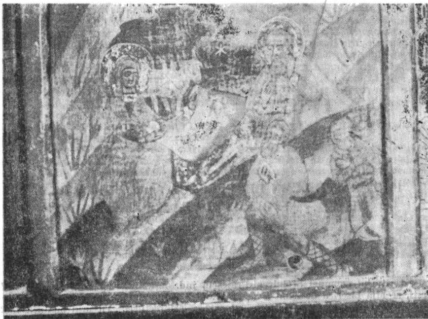
Fig. 1 — Icoana „Nasterca Domnului“