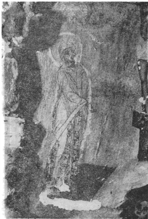
Fig. 3 — Detaliu icoana „Răstignirea”