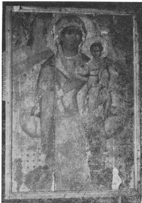
Fig. 6 — Icoana „Maica Domnului“