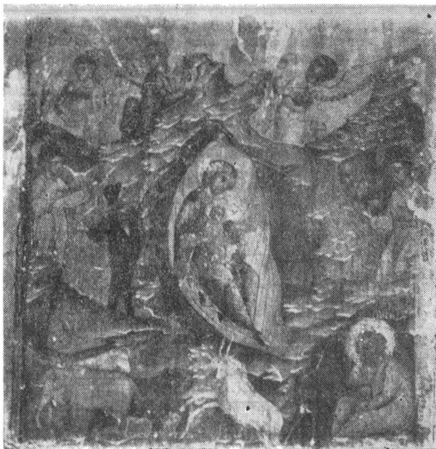
Fig. 7 — Icoana „Nașterea lui Isus Christos”