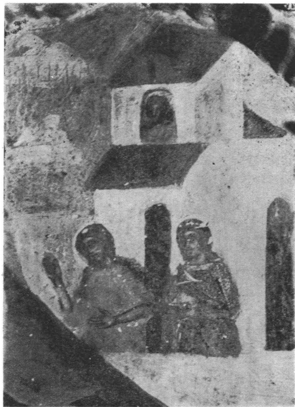
Fig. 4 — Detaliu icoana „Nașterea Fecloarei”