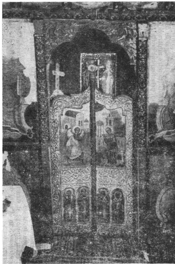
Fig. 1 – Ușile împărățești de la biserica „Sf. Gheorghe”, Schela