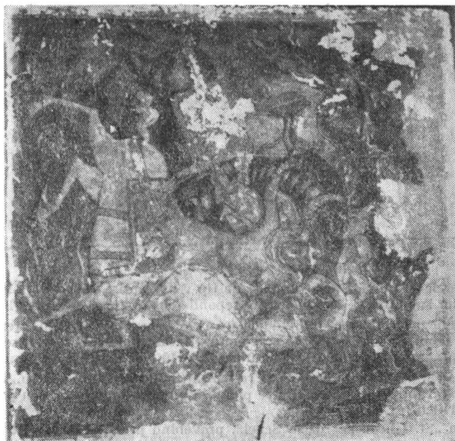
Fig. 8 — Icoana „Călătoria regilor magi”