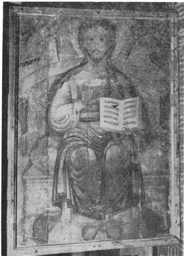
Fig. 5 — Icoana „Isus Christos“