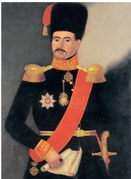
Fig. 16. Miloš Obrenović (d. 1835)