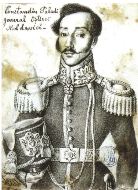
Fig. 8. Generalul Constantin Paladi (c. 1830)