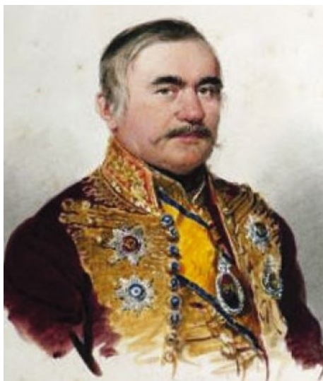
Fig. 17. Miloš Obrenović de M. Dafinger (1842)