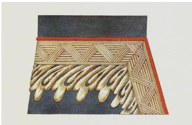
Fig. 10. Gulerul tunicii de colonel (a. 1836)