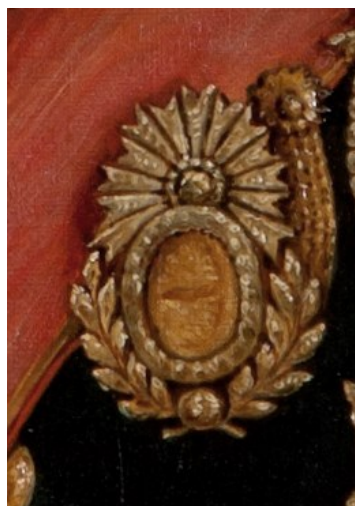
Fig. 6. Ordinul otoman Nisban Istikbar