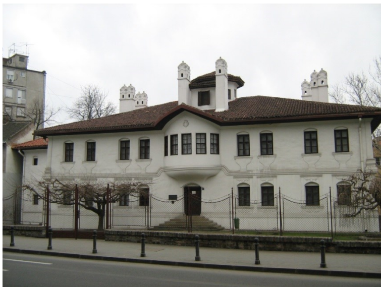
Fig. 3. Reședința prințesei Ljubica (Belgrad), astăzi muzeu