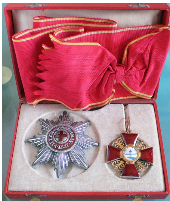
Fig. 7. Ordinul rusesc St. Ana , cls. I