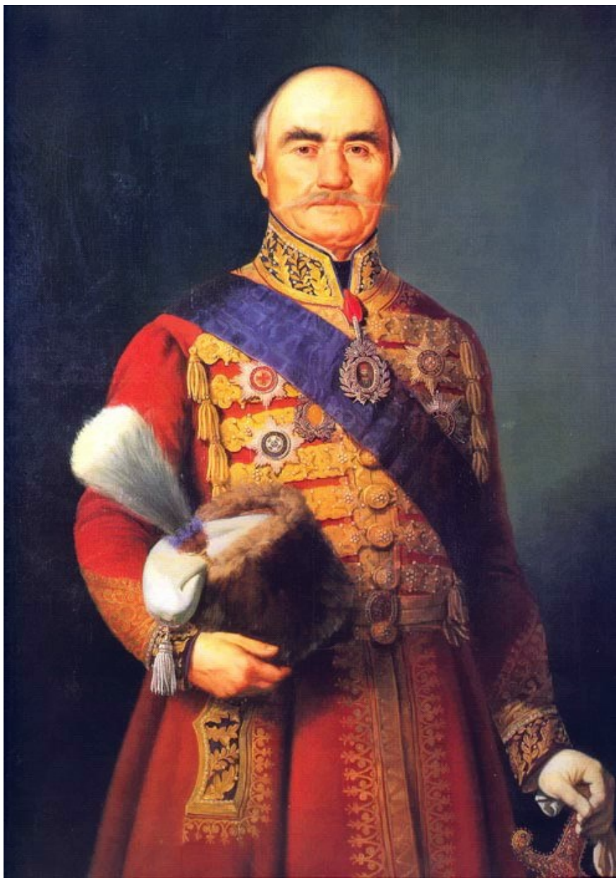
Fig. 11. Miloš Obrenović (a. 1848), portret de Moritz M. Dafinger (copie)