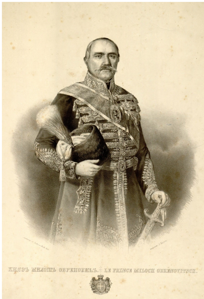
Fig. 13. Principele Miloš Obrenović litografie de A. Ioanovici, 1852, imprimată de J. Haler