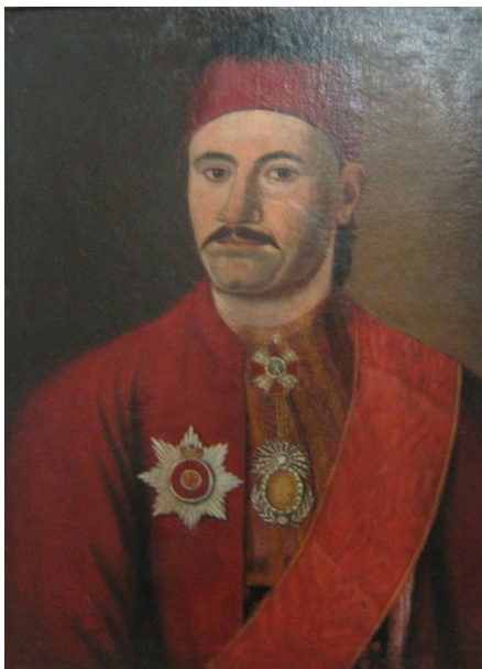
Fig. 15. Anonim, Milan Obrenović, (d. 1835) (Muzeul Național Belgrad)