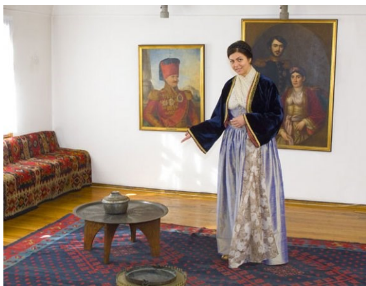
Fig. 4. Portretul lui Miloš Obrenović expus în Muzeul „Palatul Prințesei Ljubica“