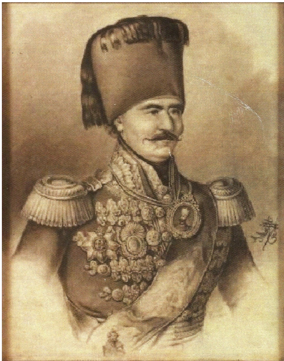
Fig. 1. „Portret de demnitar turc”, desen de Josef Aug. Schoefft (colecția Mihai Dim. Sturdza)