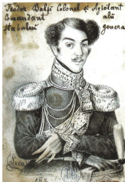
Fig. 9. Colonelul Theodor Balș (c. 1830)