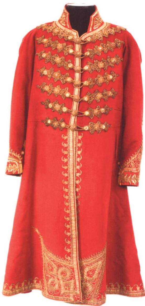
Fig. 12. „Dolmanul” principelui Miloš Obrenović (reconstituire) (Muzeul Național din Belgrad)