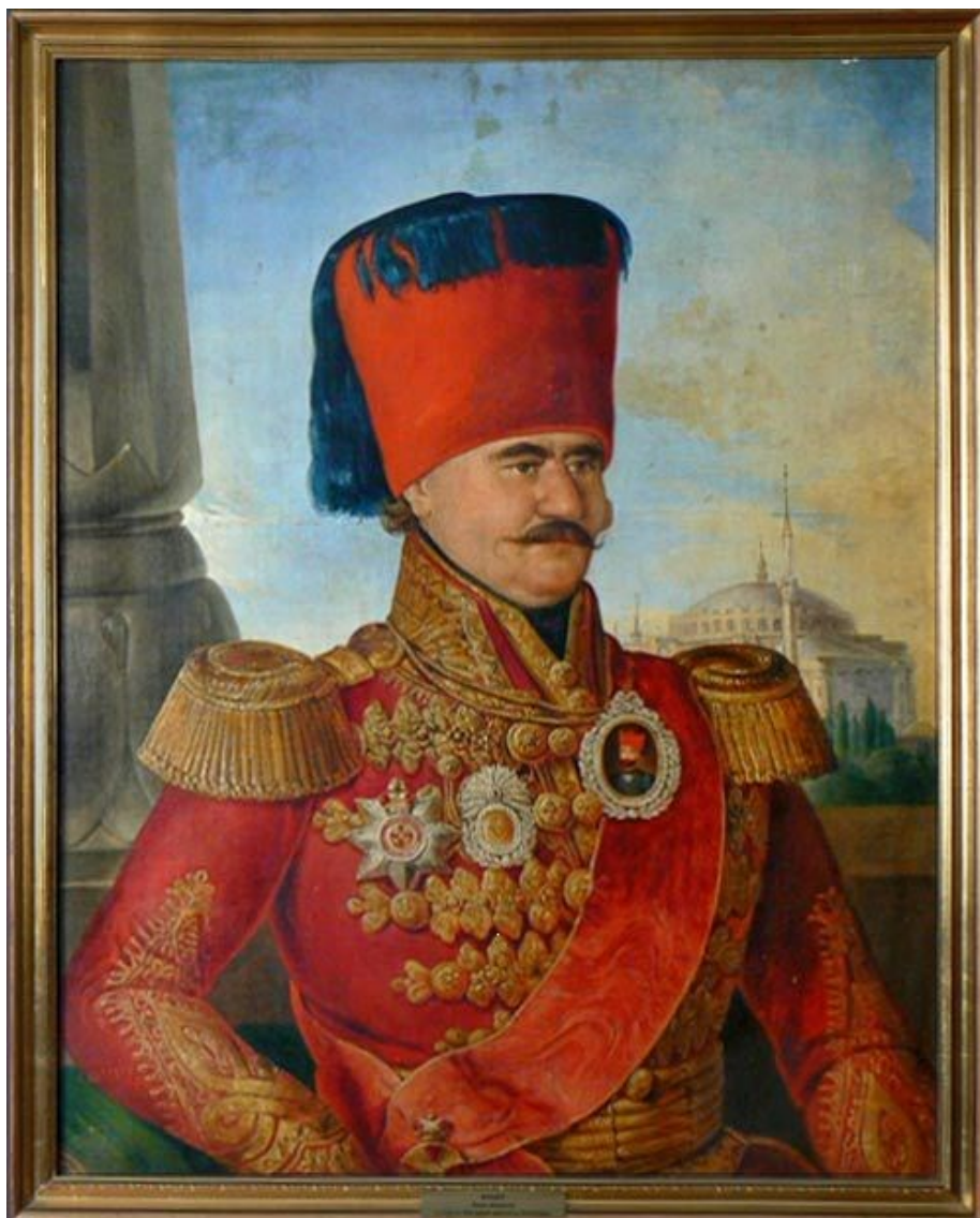
Fig. 2. Miloš Obrenović, portret de Josef Aug. Schoefft, 1835 (Muzeul de Istorie din Belgrad, copie din 1858?)