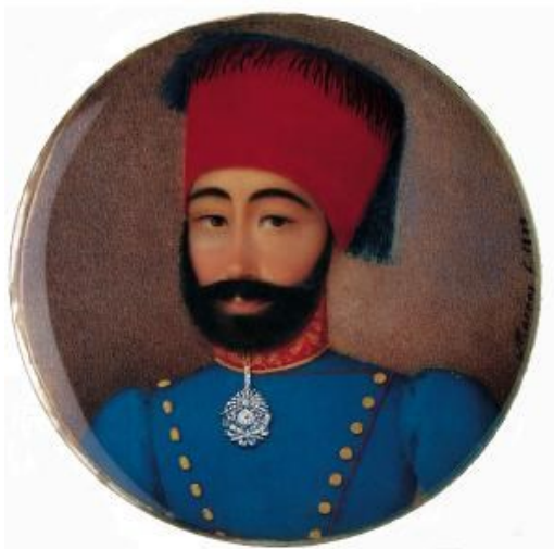
Fig. 5. Portretul-medalion al lui Mahmud II