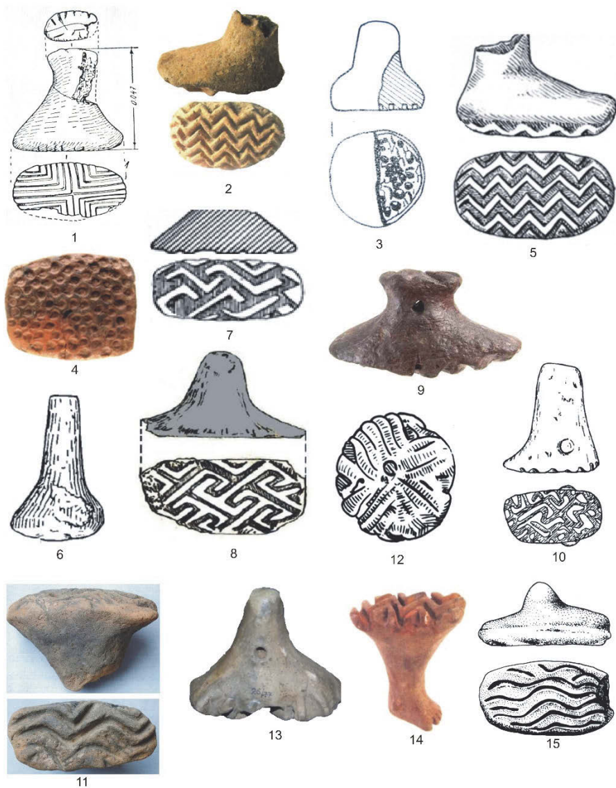
Fig. 1. Pintadere Starčevo-Criș: 1. Bursuci, 2. Copăcelu, 3-4. Gura Baciului, 5. Gura Văii, 6-7. Perieni, 8. Poienești, 9. Tășnad, 10. Trestiana, 11. Suplacu de Barcău, 12. Verbița, 13-14. Zăuan, 15. Beșenova Veche (după: 1. Coman, 2. Tulugea, 3-4. Lazarovici, 5. Dumitrescu, 6-7. Petrescu-Dîmbovița, 8. Lazăr, 9-10. Popușoi, 11. Lazarovici, 12. Berciu, 13-15 Makkay; scări diferite)