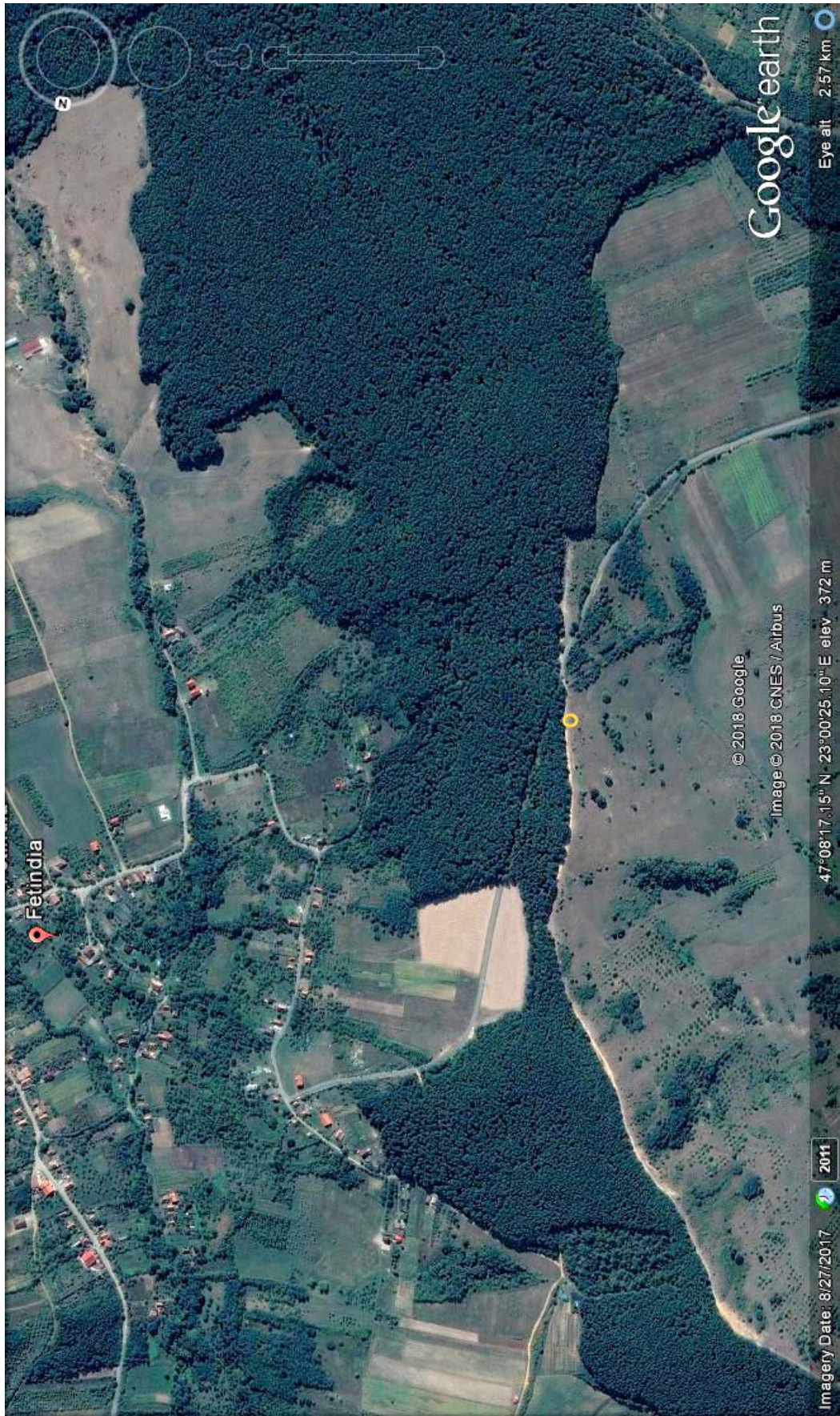
1 Planșa 1