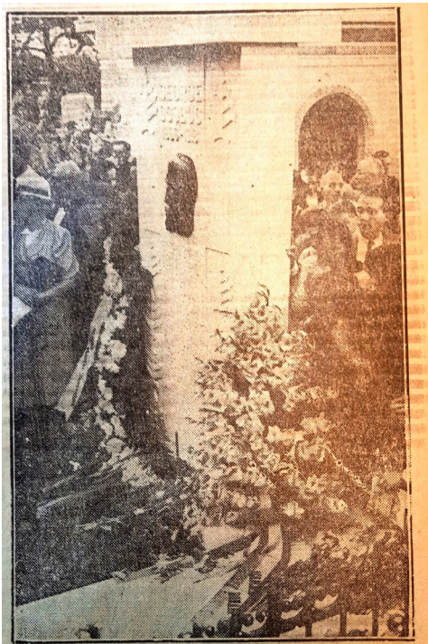
Piatră funerară desvelită ieri De mormântul poetului Gh. Coșbuc, la Cimitiul Bellu