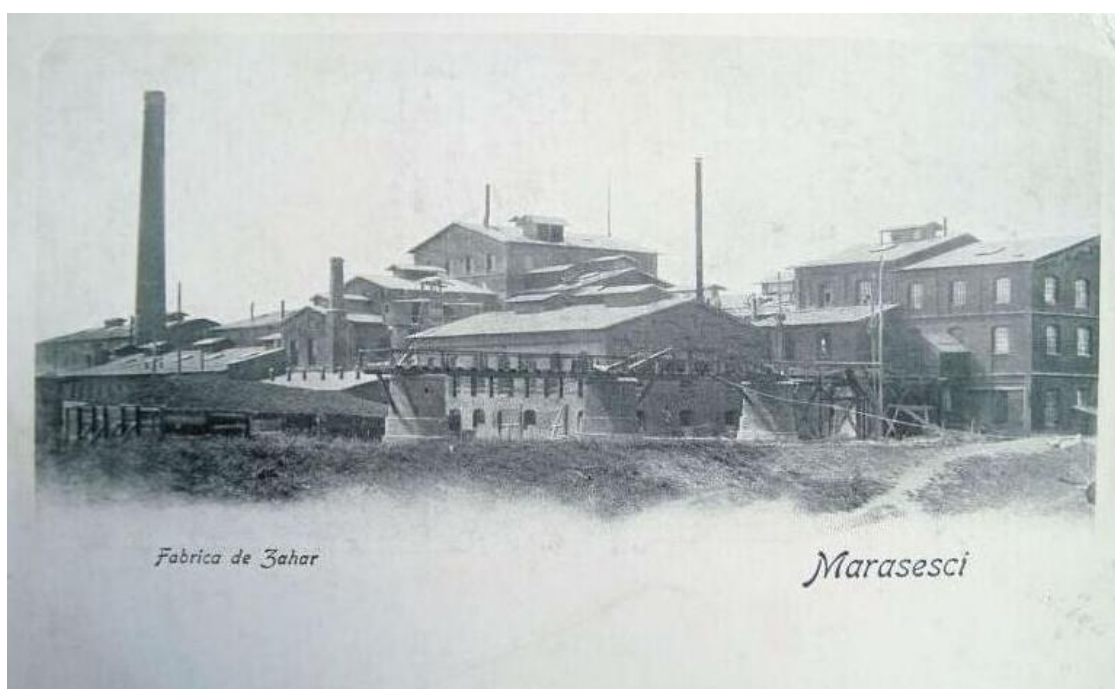
Foto 1. Fabrica de zahăr de la Mărășești-1900 8