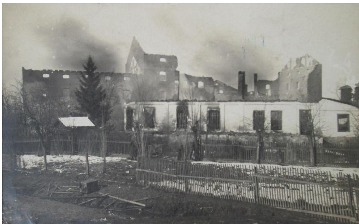
Foto 9. Fabrica de zahăr de la Mărășești după distrugerea din august 1917 15