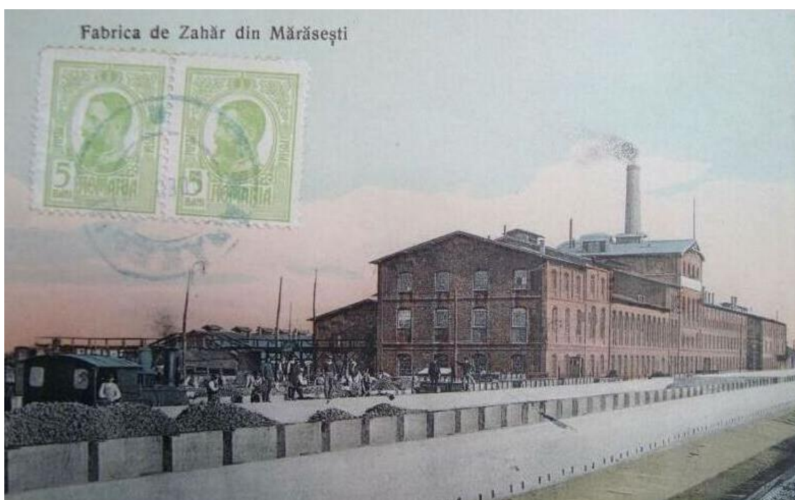
Foto 2. Fabrica de zahăr de la Mărășești-1909 9