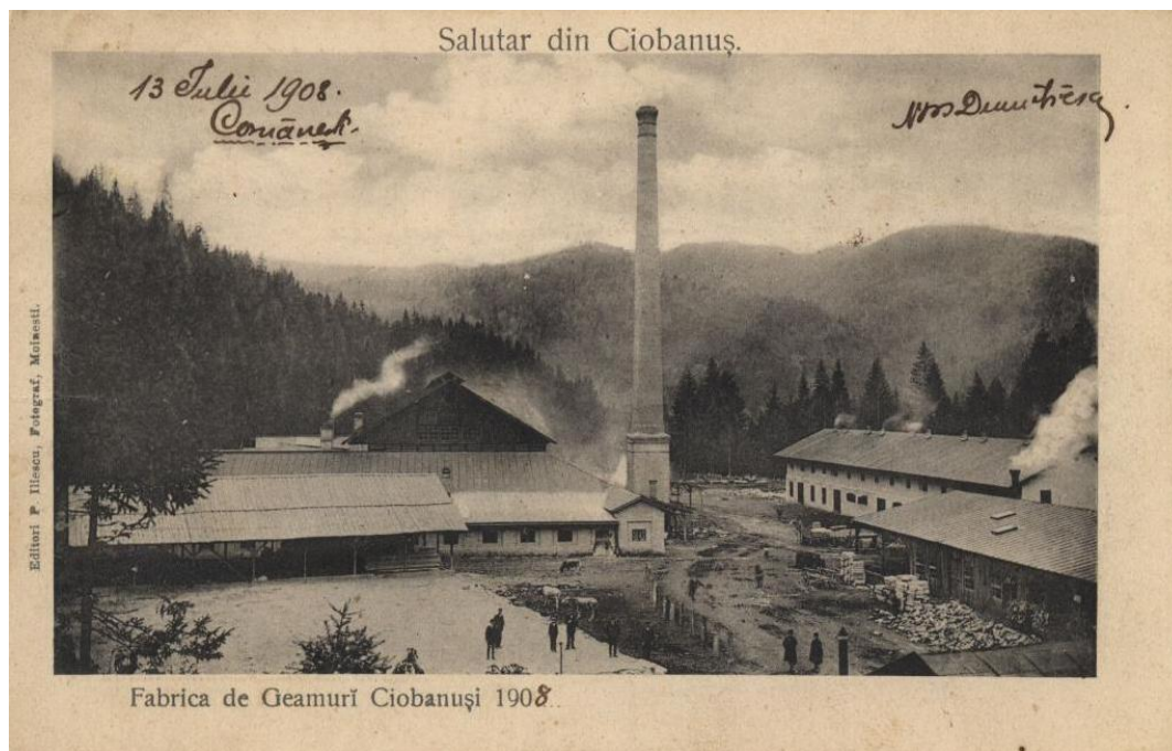
Fabrica de geamuri Ciobănuși 1908 – carte poștală

ale vremii sau în fotografiile de epocă. În fotografiile 2 și 3 vă prezentăm două imagini care surprind fabrica din două unghiuri diferite. Prima este o carte poștală datată 1908 7 și aparține unui colecționar german, Dieter Neumann. Cea de-a doua fotografie, găsită pe internet, 8 este nedată, însă aceeași imagine o întâlnim reproducută în Monografia Comunei Asău (Albu 1996 257, foto 33), unde este precizat anul 1904.