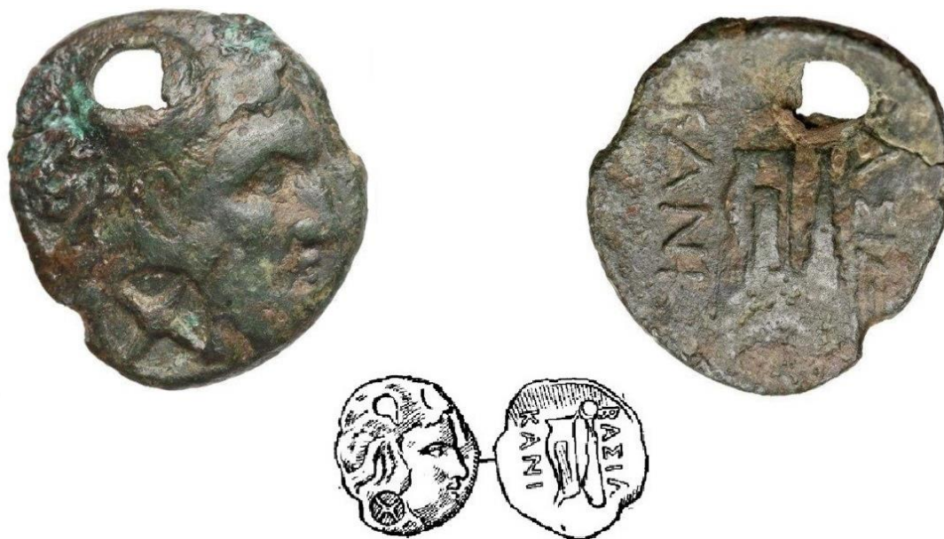
Fig. 2 - Moneda arhiepiscopului R. Netzhhammer.

Cum nu ne-am propus să rediscutăm fenomenul contramărcării monedelor în antichitate, ne oprim aici cu considerentele legate de acesta și mai departe ne limităm la a discuta doar despre contramarca histriană de tip „roată cu patru spițe”. Contramarca de tip „roată cu patru spițe” este de mult timp cunoscută, fiind pentru prima dată publicată în 1914 de Netzhhammer (Canarache 1950 243), pe o monedă a regelui scit Kanites (pl. 1, nr. 1). V. Canarache reia în discuție această monedă în 1933-1934 4 și în 1950 (Canarache 1950 243), punând contramarca de tip „roată cu patru spițe”, indiscutabil, pe seama Histriei. Celebra monedă a arhiepiscopului R. Netzhhammer, cunoscută lumii științifice vreme de zeci de ani doar prin intermediul desenului publicat în 1914, a fost vândută la data de 01 Iulie 2015, la o licitație publică, pe sit-ul www.ebay.com , de către casa de licitații „Numismatic Cabinet – D. Marciniak” din Polonia 5 .