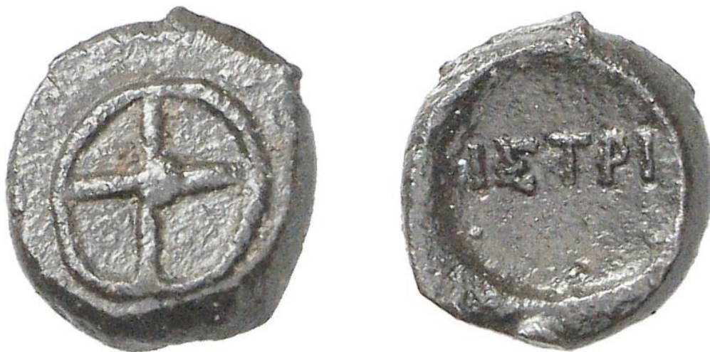
Fig. 3 - Monedă histriană „târzie” de tip „roată cu patru spițe”.

Această lungă persistență în uz a simbolului monetar histrian „roată cu patru spițe” este demonstrată și de emisiunile bătute de acest tip, ce au pe avers legenda „ΙΣΤΡΗ”, emisiuni monetare cu o datare nu tocmai clară (a se vedea fig. 3 13 ).