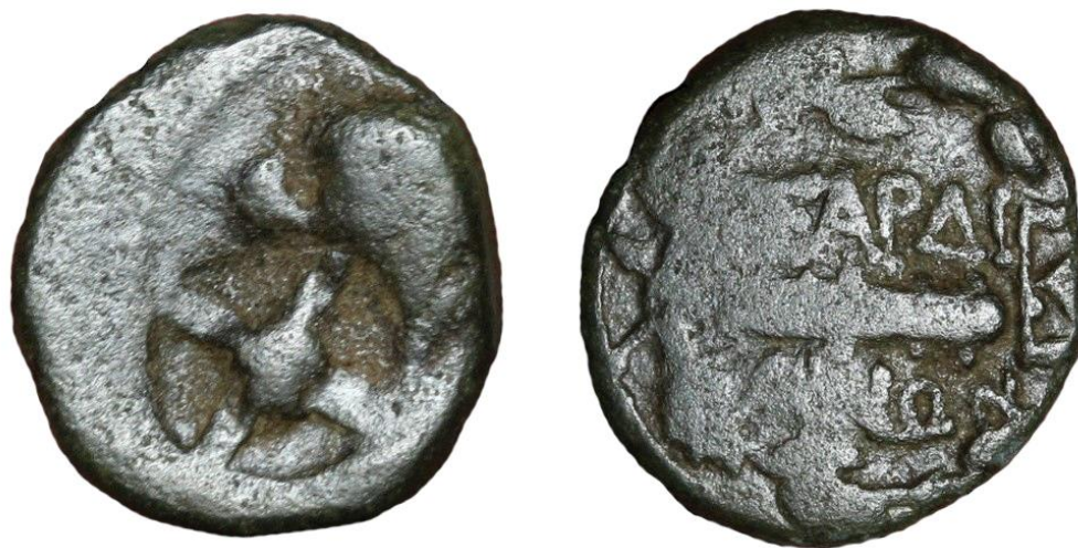
Fig. 1 - Monedă bătută la Sardes (Lydia) care prezintă pe avers o contramarcă histriană de tip „roată cu patru spițe”.

Ref. SNG Copenhagen, AV/RV descris la nr. 470-482, dar pentru moneda noastră monogramă incertă sau necuprinsă de catalog 3 . Datare: secolele II-I a.Chr.