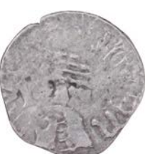
Planşa 3 (2:1)