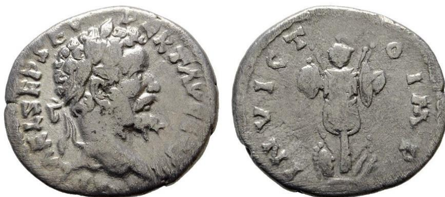
Fig. 1 – Denar emis de împăratul Septimius Severus, vândut la licitația Artikel nr. 201551