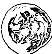
Monede dacice din tezaurul de la Periș, jud. ilfov