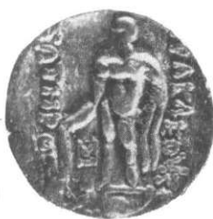
Pl. II. — Nr. 1—8, monede emise la Thasos, aflate în tezaurul de la Hilib, jud. Covasna.