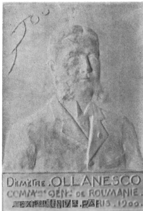
Pl. I. — Nr. 1, placheta Pavilionului central al României; nr. 2, placheta dedicată în anul 1900 Comisarului general al României la Expoziția de la Paris (av.).